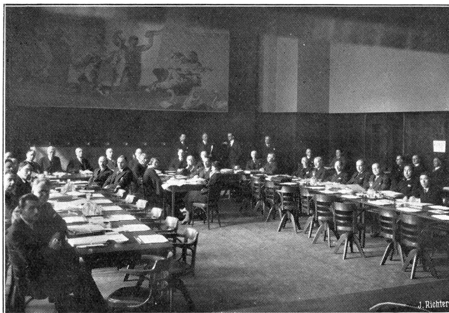
Sitzung der Rohstoffkommission in Genf.