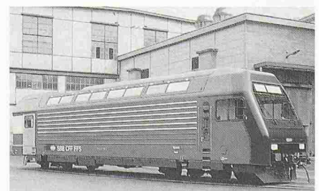
S-Bahn-Lokomotive Re 4/4 V der SBB