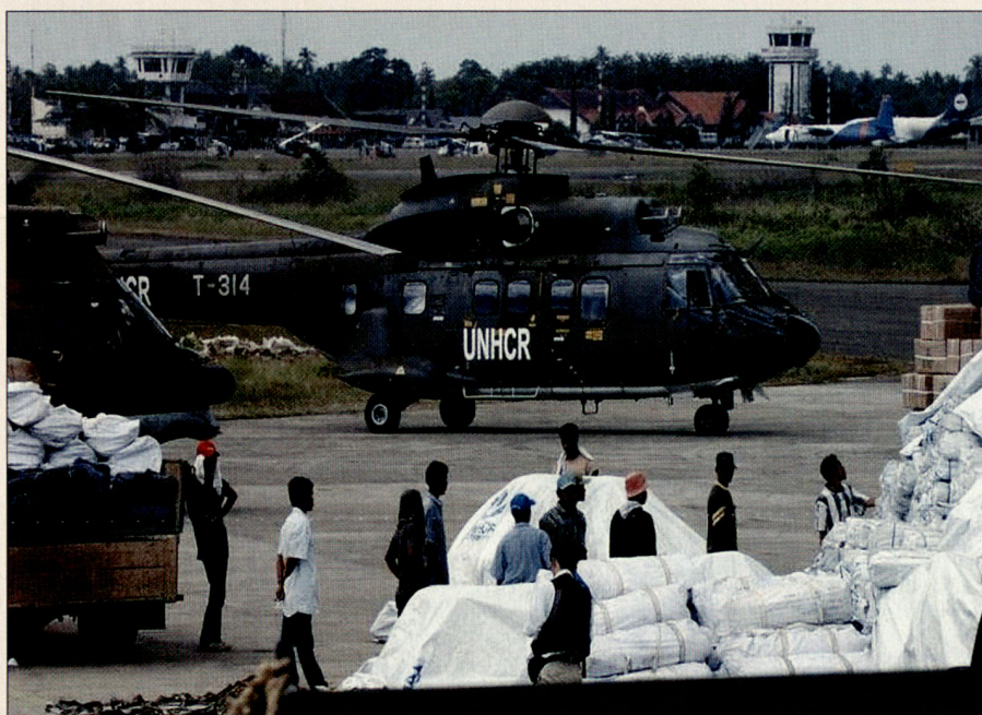
Die Helikopter fliegen im Auftrag des UNHCR.

Mitte Februar erklärte die indonesische Regierung die Phase der Soforthilfe als beendet. Die Vereinbarung mit dem UNHCR legte den 27. Februar als letzten Einsatztag fest. Insgesamt produzierten wir an 42 Flugtagen 477 Flugstunden praktisch ohne technische oder operationelle Probleme und transportierten 370 t Material und 2300 Personen. Nun erfolgte der Rücktransport des Materials (3 Super Puma, 4 Container, 1 Shelter, gesamthaft 45 t Material) wiederum mit 2 AN-124. Am 12. März traf das Gros der Task Force wie-