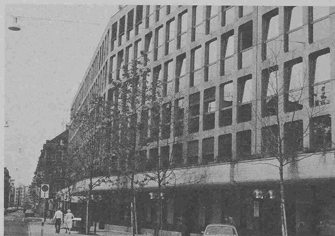
Verwaltungsgebäude der Kreistelefondirektion Zürich. Fassade aus Aluminium-Herdgussplatten

Der Martin Hilti-Preis für wissenschaftliche Arbeiten rundet die Palette von Jubiläumsvergaben ab. Der Preis ist für herausragende Arbeiten zum Thema Management- und Führungslehre gedacht und soll alle zwei Jahre in Zusammenarbeit mit der Hochschule St. Gallen und mit der Wirtschaftsuniversität Wien verliehen werden. Er ist mit jeweils 25 000 Franken dotiert.