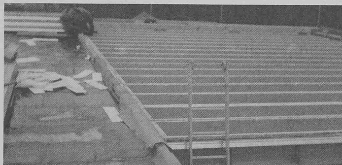
DLW-Dachelemente Typ T 90/75 als Verwendung für Flachdachkonstruktion

Die Struktur des Elementes mit dem schwalbenschwanzförmigen Holobrib-Profil zeigt eine saubere, panelartige flache Untersicht. Bei der Anwendung dieser Bauelemente im Flachdachbau bringt diese Untersichtstruktur einen weiteren Vorteil. Die Abhängemöglichkeit für heruntergehängte Decken, Beleuchtungen und Versorgungsleitungen im Schwalbenschwanz, ohne Verwendung zusätzlicher Ankerschienen sind gegeben, so dass die Abhängung mühelos mit Spezialschrauben