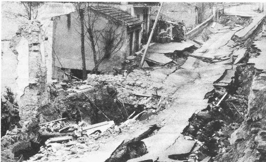
Bild 2. Strassenschäden in Calitri

bardi, Conza di Campania, Lioni und Laviano. Das Epizentrum des Bebens liegt etwa 5–7 km nördlich von Laviano, wobei sich das Gebiet mit grossen Schäden von Avellino bis Potenza in west-östlicher Richtung und von Grotaminarda bis Salerno in nord-südlicher Richtung erstreckt und eine Fläche von annähernd 3000 km 2 überdeckt. Innerhalb dieses Bereichs wurden im Mittel Intensitäten von VII und grösser in der MSK-Skala angetroffen. Darüber hinaus wurde das Beben bis zu relativ grossen Entfernungen von 700–800 km in Norditalien wahrgenommen.