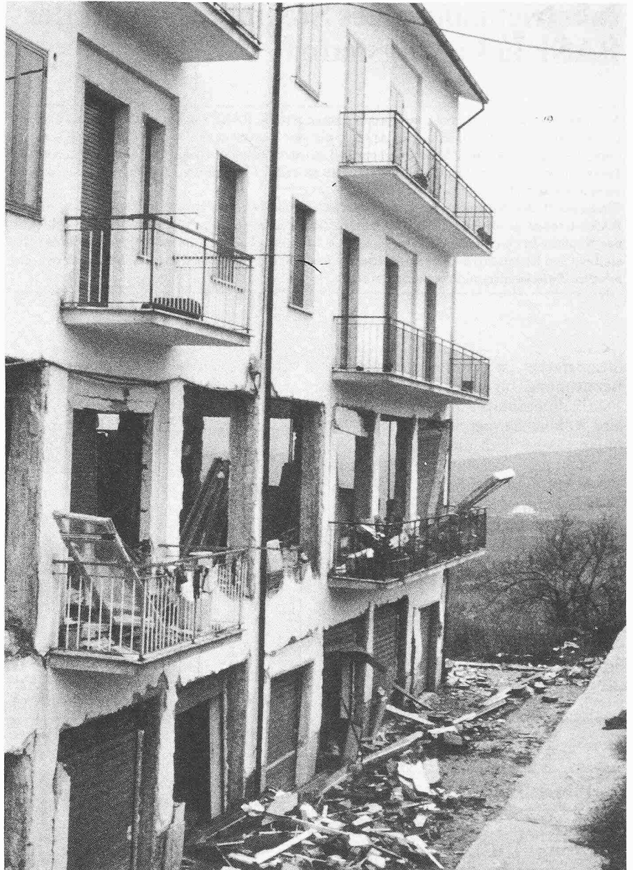
Bild 4. Stahlbetonskelettbau in S. Angelo dei Lombardi. Die Füll- und Zwischenwände in den untersten zwei Geschossen sind grösstenteils zerstört. Bedeutende Schäden an der Tragstruktur

Die an Strassen beobachteten Schäden waren im allgemeinen nicht schwerwiegend. Vollständige Strassenunterbrüche infolge des Erdbebens traten nur sehr selten auf. Hingegen führten, namentlich im Epizentralgebiet Setzungen des Dammkörpers bei Brückenwiderlagern, Bachdurchlässen und Unterführungen zu Unterschieden in Fahrbahnhöhe von bis zu 40 cm. Diese wurden unmittelbar nach dem Beben durch angeschüttete Rampen provisorisch repariert. Entsprechend waren diese Strecken zum Teil nur mit stark reduzierter Geschwindigkeit befahrbar. Vielerorts konnten auch breite Risse im Belag