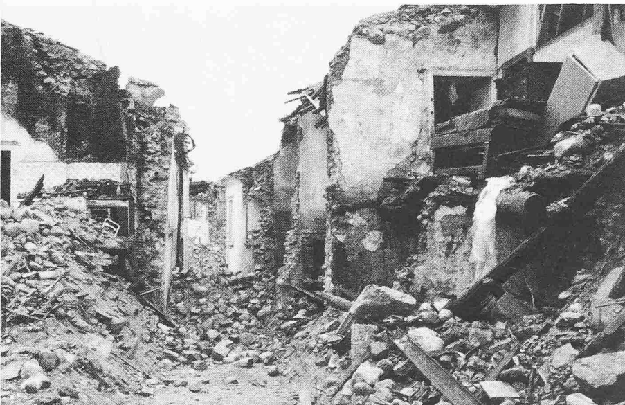
Bild 3. Alter Dorfkern von San Angelo dei Lombardi

Besonders spektakulär sind zwei Rutschungen bei San Fele und eine Rutschung in Calitri. Alle drei sind mehr als 500 m breit und bis zu 1,3 km lang. Die grösste Verschiebung von gegen 150 m wurde bei einem der beiden westlich von San Fele gelegenen Rutschungen beobachtet. Die Gebäude im Rutschungsgebiet wurden dabei vollständig zerstört. Grösste Schäden an alten und neuen Gebäuden verursachte die Rutschung, die weite Teile des Städtchens Calitri erfasste (siehe Bild 2), wobei der durch das Beben direkt verursachte Schaden weniger ins Gewicht fällt. Die Anrisszonen der verschiedenen Teilrutschungen im oberen Teil des Städtchens weisen sowohl horizontale