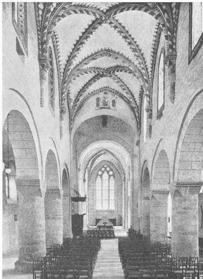
Bild 333. Romainmôtier, Inneres mit Blick gegen den Chor (verkleinerte Gesamtwiedergabe)

Eine Abbildung wirkt umso intensiver, je mehr sie sich auf das konzentriert, was im gegebenen Fall gezeigt werden soll, unter Verzicht auf alles, was dazu nichts beiträgt – eine Binsenwahrheit. Umso erstaunlicher, wie oft und beharrlich dagegen verstossen wird. Für einen Verkehrsprospekt wird