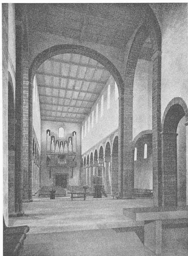
Bild 361. Schaffhausen, Klosterkirche Allerheiligen. Blick aus dem Sanktuarium gegen Vierung und Langhaus (verkleinerte Gesamtwiedergabe)

Mit dieser Forderung nach dem Wirkungsmaximum durch Konzentration auf das Unentbehrliche kommt man dem Grafiker in die Quere: er wünscht für die Buchausstattung gleichgrosse, vielleicht sogar gleichproportionierte Bildrechtecke, und diesem, von der Aufmachung herkommenen Wunsch zuliebe bleibt Überflüssiges stehen – was so unsinnig ist, wie wenn man einem Verfasser zumuten wollte, alle Abschnitte seines Textes müssten dem graphischen Effekt zuliebe gleichviel Zeilen lang sein.