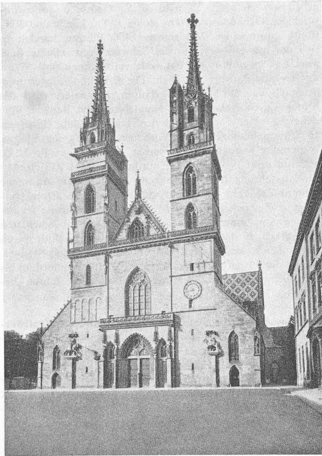
Bild 410. Das Münster in Basel, Westfassade (verkleinerte Gesamtwiedergabe)

Das oben zur Staffage Gesagte bedarf übrigens der Präzisierung: als massstabsetzendes Element wäre eine menschliche Figur auch auf wissenschaftlichen Architekturabbildungen oft nützlich, besonders auch auf Bildern von Ausgrabungen usw. Der Betrachter ist nicht selten ratlos, in welchen Dimensionen er sich den betreffenden Raum, Bau oder Gegenstand