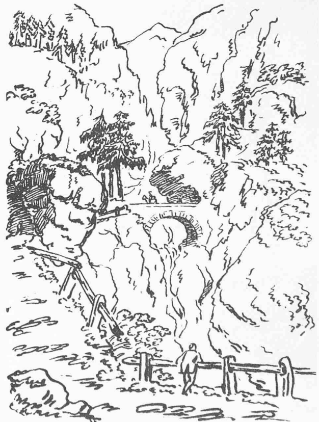
Die Via Mala, Federzeichnung von Johann Wolfgang Goethe, 1. Juni 1788