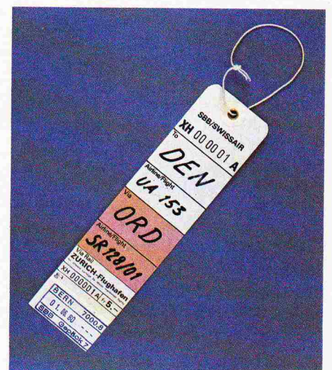
Bild 3. Fly-Gepäcketikette. Die Reise geht von Bern über den Flughafen Zürich nach Denver, Colorado, USA. In Chicago O'Hare wird vom Swissair-Kurs 128 auf Flug 153 der United Airlines umgeladen

dens und des Berner Oberlandes in Betrieb genommen werden konnten. Mit der Eröffnung des Flughafenbahnhofs in Zürich ist ein weiterer Ausbauschritt fällig. Ab 1. Juni 1980 sind die in Tabelle 1 aufgeführten Fly-Gepäckabfertigungsstellen in Betrieb. Im Endausbau wird das Angebot auf rund 100 Abfertigungsstellen ausgedehnt.