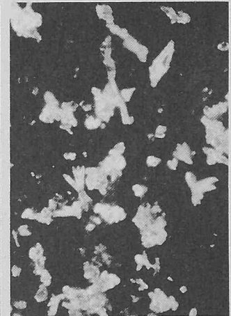
Kalkausfällung mit Crustex (600× vergrössert)

diese Kristallpartikel – bedingt durch ihr Eigengewicht – zum Teil auch auf den Boden dieser Objekte ab, allerdings wie bereits beschrieben nicht in der bekannten, steinharten Form, sondern als eine amorphe Masse. Dass die Reinigungsintervalle dadurch wesentlich verlängert, wenn nicht sogar überflüssig gemacht werden, versteht sich von selbst. Die Reinigungsarbeiten selbst können schnell, einfach und kostensparend erfolgen. Ein weiterer Vorteil ist der verminderte Seifenverbrauch bei Waschprozessen. Die Ersparnis