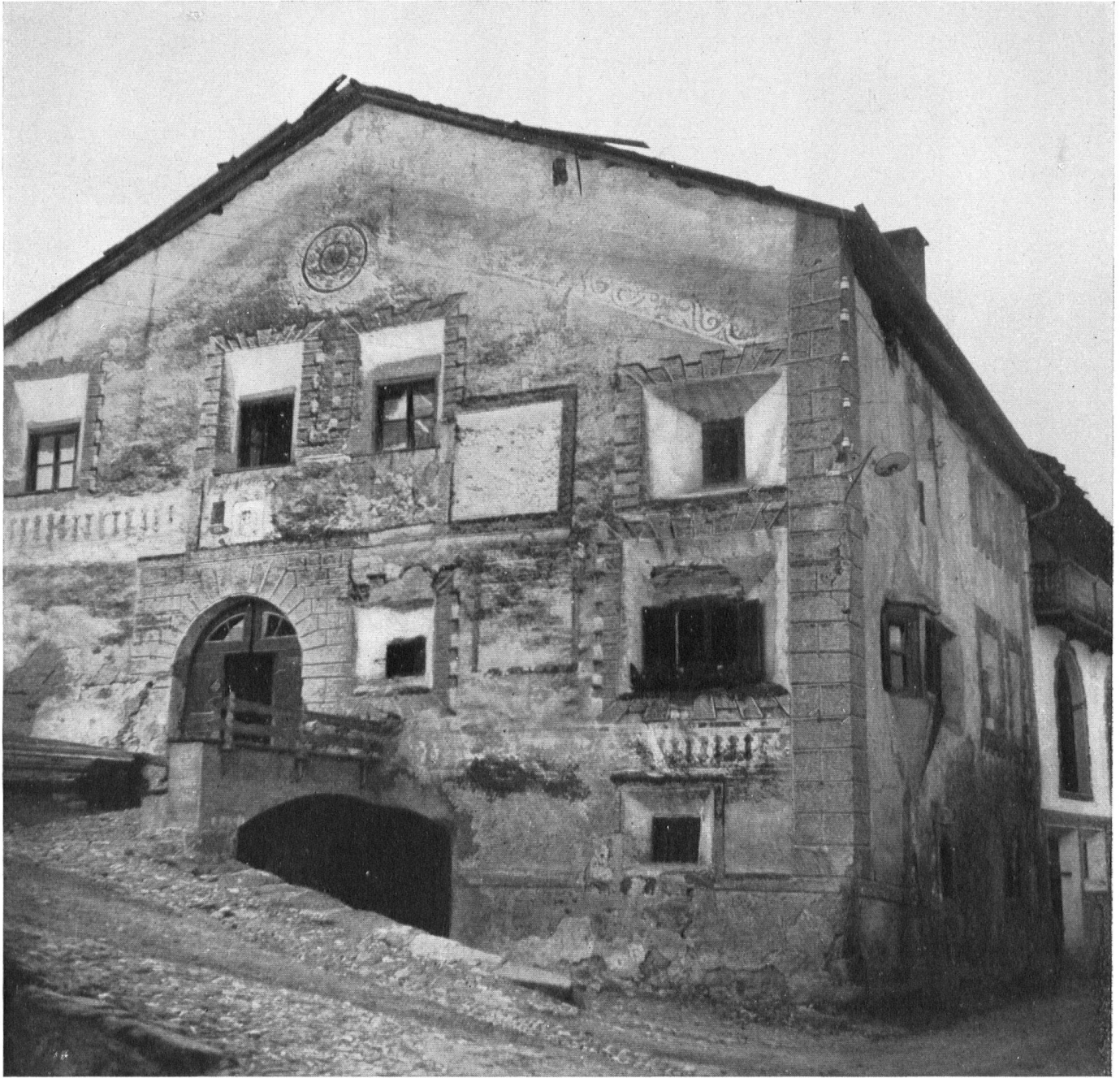
Ardez im Unterengadin. Zerfallenes Haus mit Sgraffitoschmuck. Allein in Ardez befinden sich mehrere Häuser dieser Art in ähnlichem Zustande. Ohne Hilfe können die unbemittelten Besitzer sie nicht in Ordnung bringen lassen. Cette maison d'Ardez (Basse-Engadine) fut agrémentée de sgraffittes. Mais elle n'est pas la seule à connaître la misère. Les propriétaires n'ont pas de ressources; il faut l'Ecu d'or. Ardez nella Bassa Engadina. Casa in rovina con ornamenti in sgraffito. In questa località si trovano parecchie case del genere nello stesso stato. Senza un aiuto dal di fuori i proprietari non sono in grado di pensare ad un riassetto.