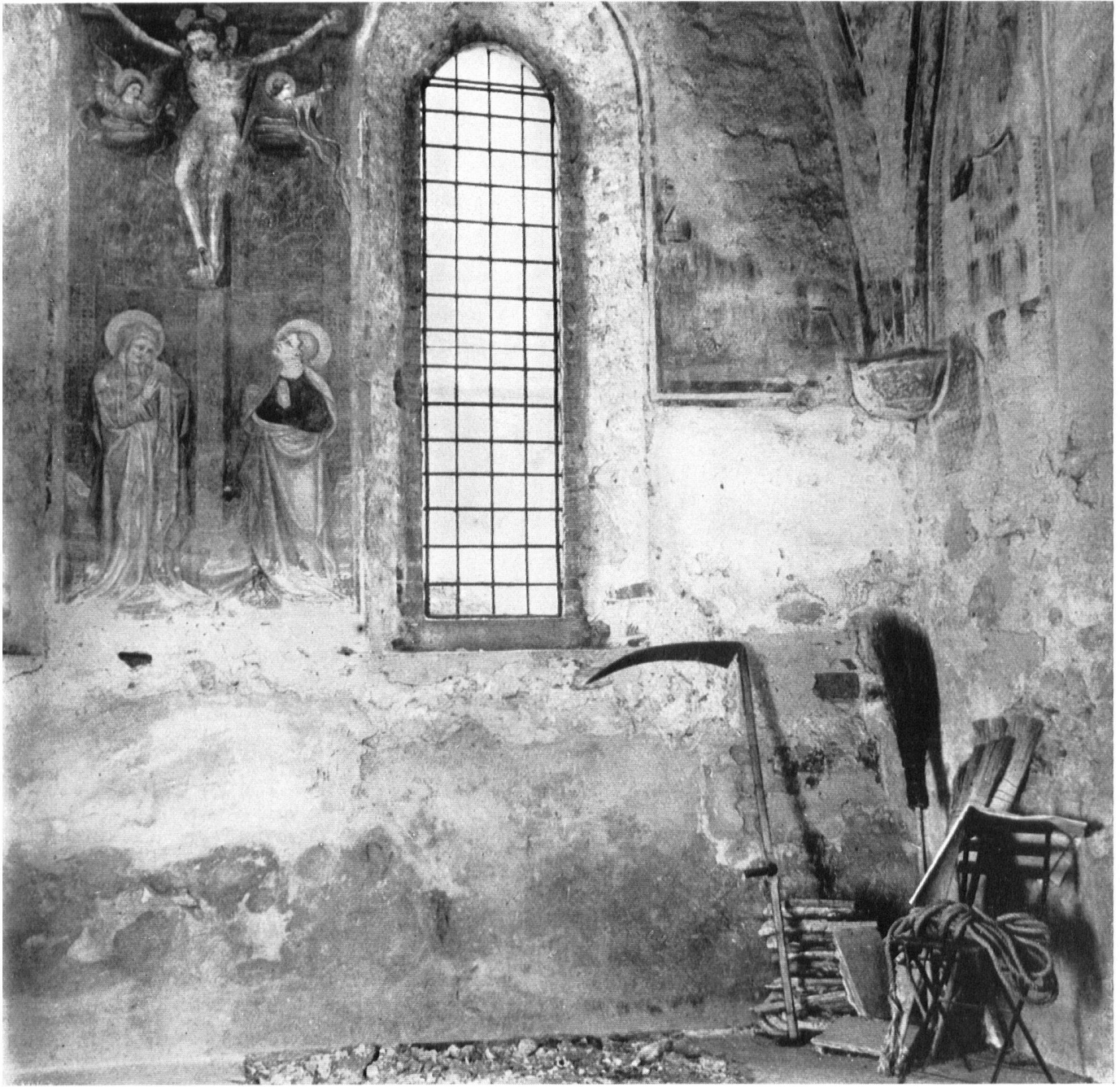
Locarno. Friedhofkapelle Santa Maria in Selva. Trotz wertvoller Fresken völlig verwahrlost. Ein unheimliches Bild, als hätte der Tod die Sense in den Winkel gestellt. Autre chapelle au cimetière de Locarno: Santa Maria in Selva et ses fresques précieuses, tombe en ruine. Locarno. La cappella di Santa Maria in Selva, completamente trascurata, nonostante i preziosi affreschi. Una visione sconcertante, d'abbandono e di morte.