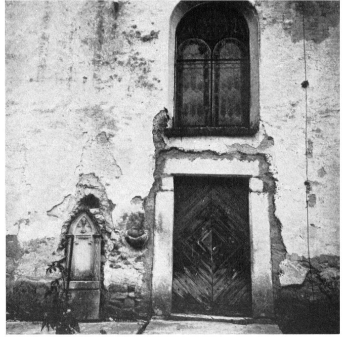
Die zerfallende Kirche in Wohlenschwil bei Melligen, die der aargauische Heimatschutz retten möchte. L'église de Wohlenschwil près de Melligen menace ruine. Pourtant, le Heimatschutz du canton d'Argovie aimerait la sauver. La chiesa di Wohlenschwil presso Melligen, che l'Heimatschutz argoviese vorrebbe salvare dalla rovina.

denn die »Kreditlein« zu erklären, zu denen sie sich für die Förderung des kulturellen Lebens, der Kunst, der Literatur, der Denkmalpflege, der Historie, eine Zeitlang sogar des Heimatschutzes, schließlich durchgerungen haben, die aber im Vergleich zu den übrigen großzügig bewilligten Staatsausgaben immer noch eine mehr als bescheidene Summe ausmachen.