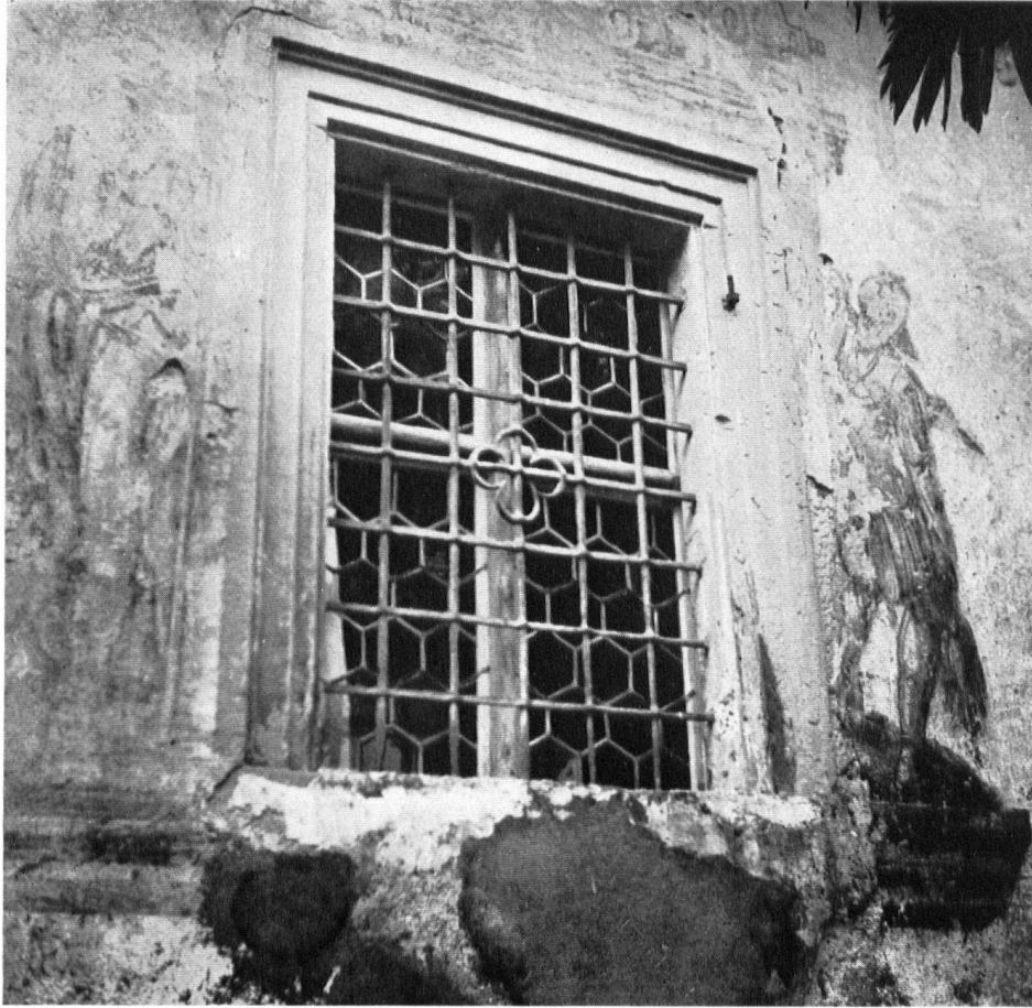
Innerschweiz. Zerfallende Fresken an einem ehemaligen Schwyzer Herrenhaus. Les peintures décoratives d'une antique maison patricienne, à Schwyz. Freschi deteriorati in una vecchia casa padronale svizzera.

cantons le soin de la vie culturelle, d'où les sommes dérisoires dont disposent les Chambres. Heureusement, les communes, les fondations, les particuliers, suppléent l'Etat dans une mesure ailleurs inconnue, ce qui permet de parer au plus urgent. Il ne faut pas oublier cependant ce qui reste à faire. On peut estimer à 10 % la contribution fédérale aux frais généraux; encore les sommes ne sont-elles versées que peu à peu et sous réserve de prestations qui peuvent porter ombrage à l'autonomie cantonale. On ne saurait pourtant parler de main-mise, puisqu'il s'agit en fait d'octroyer au bâtiment subventionné le rang d'un édifice jugé digne de l'intérêt national.