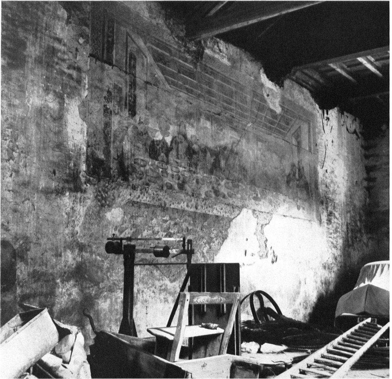
San Fedele in Roveredo: An der Wand eine Abendmahlsdarstellung. Sur la paroi délabrée de San Fedele, s'effrite la fresque de la Sainte Cène. San Fedele a Roveredo. Sulla parete una rappresentazione della «Cena».