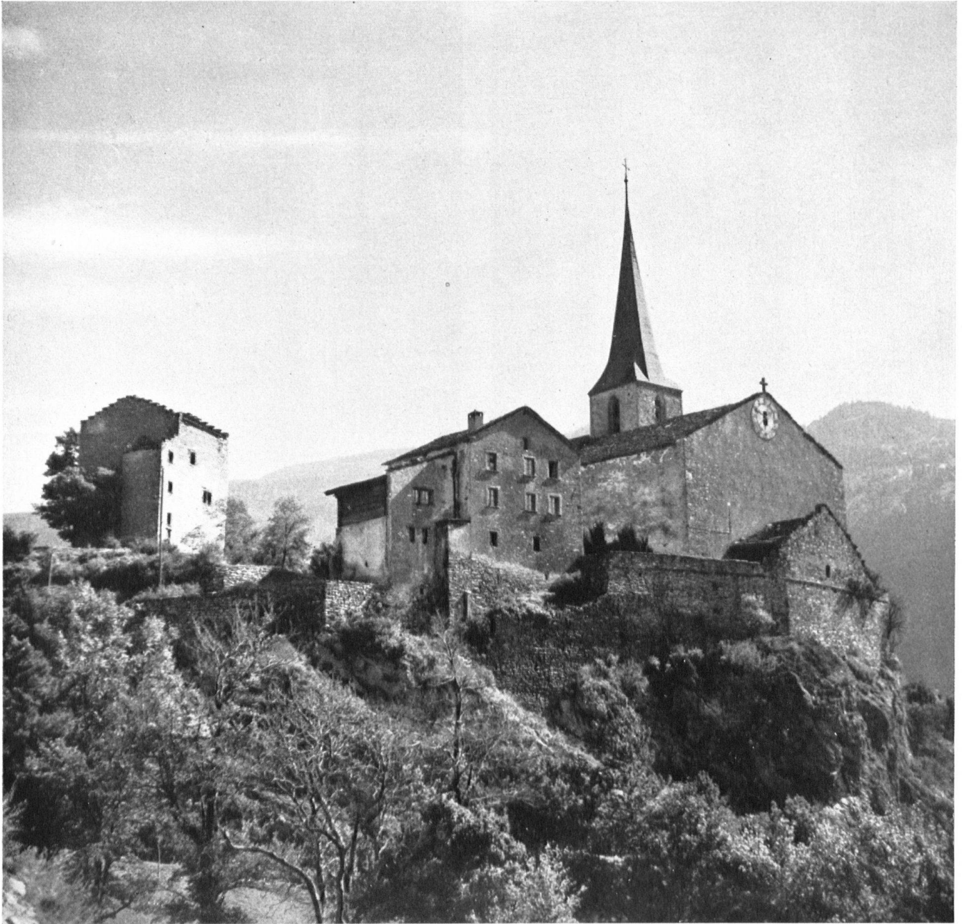
Auch das Wallis ist reich an bürgerlichen Baudenkmalern, von denen viele Not leiden. Blick auf die Burg von Raron; links außen das alte Rathaus. Le Valais est un de nos pays les plus riches en édifices de valeur. Mais ils croulent sous le poids des ans. Voici le bourg féodal de Rarogne et l'antique Maison de ville. Anche il Vallese è ricco di belle costruzioni civili in stato di deperimento. Veduta della cittadella di Raron; a sinistra l'antica Casa Comunale.