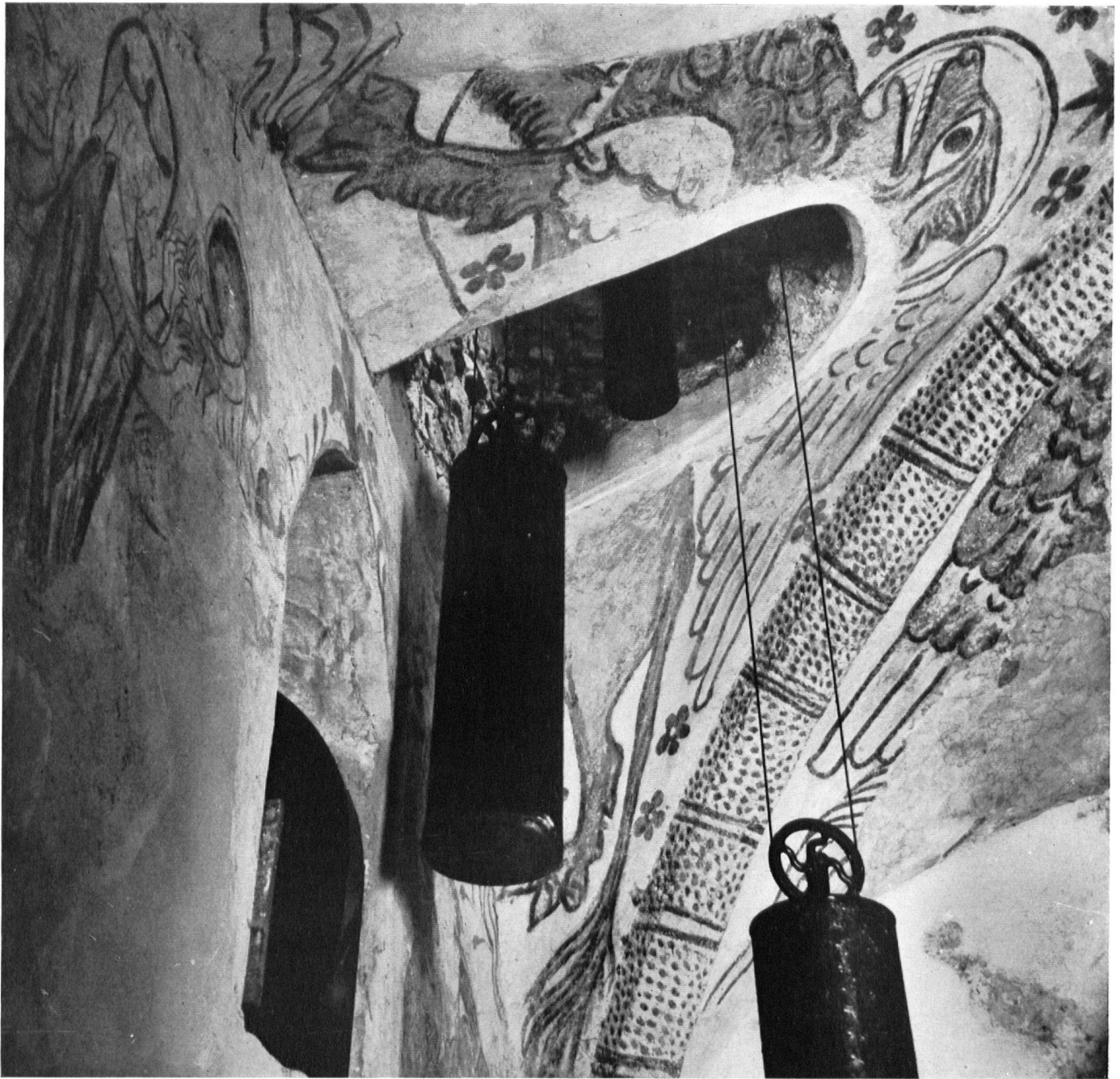
Kirche Zell. Das in die Fresken geschlagene Loch mit den Gewichten der Kirchuhr. On détruit la décoration murale pour faire passer les contre-poids d'horloge. Chiesa di Zell. Gli affreschi rovinati per far posto ai pendoli dell'orologio.