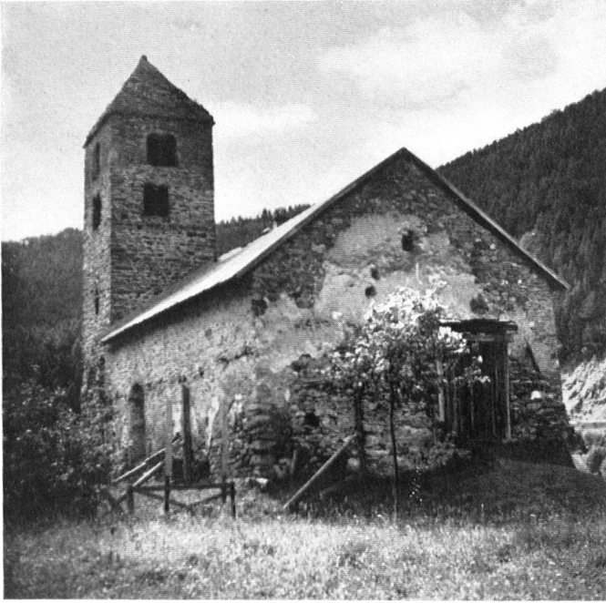
San Nicola bei Strada, Unterengadin, als Heuschopf benützt. San Nicola, à Strada (Basse-Engadine) sert aujourd'hui de grange. San Nicola presso Strada, nella Bassa Engadina, trasformata in fenile.