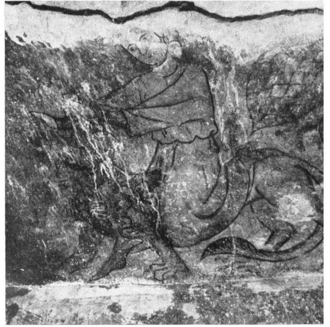
Schloß Brandis, Maienfeld (Grb.). Simsons Kampf mit dem Löwen, um 1300. Au château de Brandis, près de Maienfeld (Grisons). La fresque de Samson combattant le lion remonte à l'an 1300. Castello di Brandis a Maienfeld (Grigioni). Sansone lotta contro il leone, del 1300 circa.

nötigen Mitteln fehlt. Man denke an die Bergkantone, die wenig Einnahmen haben, von denen aber manche besonders reich an Kunstdenkmälern sind (Wallis, Tessin, Graubünden, Urschweiz). Aber selbst da, wo genügend Mittel vorhanden wären, wird oft beschämend wenig getan. Mancherorts sei »seit Jahren und vielleicht Jahrzehnten von der öffentlichen Hand kein Rappen für solche Zwecke aufgebracht worden«. Zum Glück gebe es aber auch Kantone, die ihre Pflicht erkennen und ihr großzügig Genüge tun.