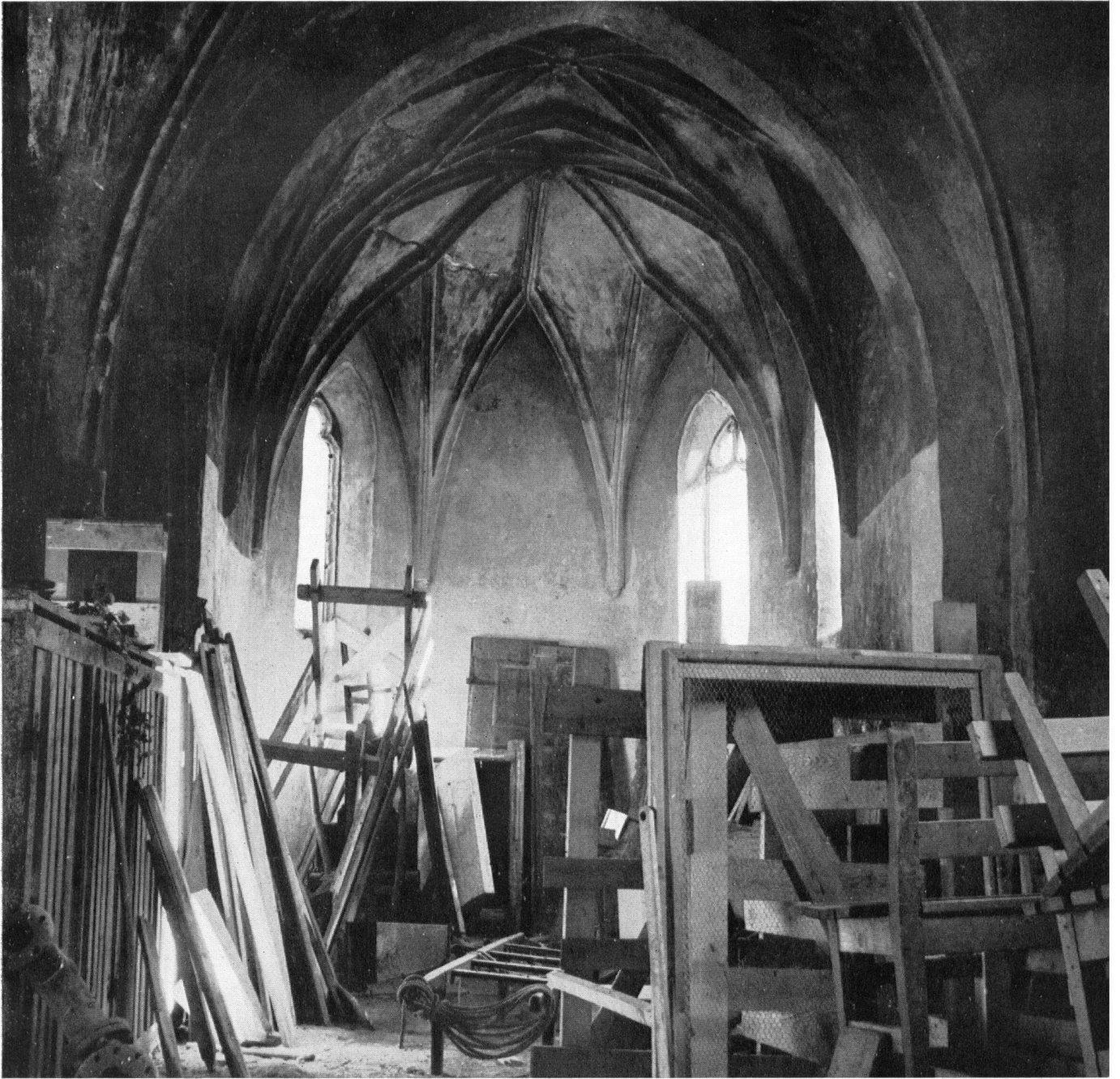
Zernez im Unterengadin. Die spätgotische Sebastians-Kapelle aus dem Jahre 1490. Unter dem Verputz befinden sich wertvolle Fresken. Bild rechts: Die Kreuzrippen im Chor, durch Teer geschwärzt, rissig und bergwärts durchfeuchtet. Die evangelische Kirchengemeinde von Zernez ist willens, das köstliche kleine Baudenkmal instandstellen zu lassen, kann aber die über Fr. 30 000.— betragenden Kosten nicht selber aufbringen und bittet den Heimatschutz um einen Beitrag aus der bevorstehenden Sammlung. A Zernez, en Engadine, la chapelle de Saint-Sébastien, qui date de 1490. Un épais badigeon recouvre ses fresques. La voûte, crevassée par l'humidité, est noircie de goudron. La paroisse évangélique est prête à entreprendre une restauration, mais la dépense est