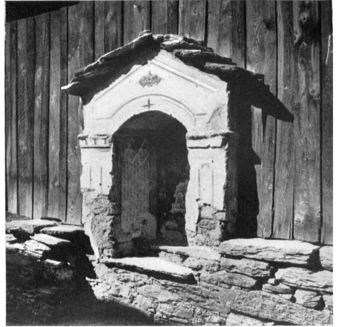
Ein Beispiel für unzählige: Bildstöckli bei Augio im Calancatal (Grb.). Un exemple entre mille: un oratoire à Augio, dans le Val Calanca (Grisons). Un esempio fra i tanti: cappelletta presso Augio in Val Calanca (Grigioni).

Hier fühlt sich die Schriftleitung der Gerechtigkeit halber allerdings verpflichtet, auf einige Besonderheiten unseres staatlichen und kulturellen Lebens hinzuweisen, die ihres Erachtens den schematischen Vergleich Birchlers nicht ohne weiteres als gerechtfertigt erscheinen lassen. In dem durch die Verfassung von 1848 geschaffenen schweizerischen Bundesstaat wurden der neuen Eidgenossenschaft nur ganz bestimmte und genau umschriebene Aufgaben zugeteilt. Was nicht in der Verfassung steht, geht die Eidgenossenschaft nichts an, und hier ist es für unsere Frage bedeutungsvoll, daß die Pflege und Förderung des geistigen und kulturellen Lebens stillschweigend, doch nicht unabsichtlich, bei den Kantonen verblieb. Im großen gesehen, verbirgt sich in diesem Grundsatz eine der großen staatspolitischen Weisheiten der Schöpfer unseres heutigen Bundesstaates. Aber er hat zweifellos auch seine Schattenseiten. Und eine derselben verdunkelt die eidgenössische Denkmalpflege. Streng genommen müßte die Eidgenossenschaft bis zum heutigen Tag es überhaupt ablehnen, sich mit diesen Dingen zu befassen. Zum Glück für unsere Denkmäler ist die Bundesversammlung auch hier im Laufe der Zeit dazu gekommen, die Verfassung ausdehnend auszulegen, und wir sind die Letzten, die ihr diese »läßliche Sünde« vorwerfen wollten. Doch bewußt oder unbewußt fühlen die Räte wahrscheinlich immer noch, daß es sich hier um eine »uneigentliche« Aufgabe der Eidgenossenschaft handle. So sind