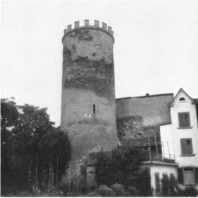
Aus dem reichen Mittelland: Der zerbröckelnde Hexenturm in Melligen. Ehedem ein Spitzturm, der erst im vorigen Jahrhundert bei einer unsachverständigen »Erneuerung« mit einem Zinnenkranz bekrönt wurde. La tour des Sorciers, à Melligen, se lézarde. Elle avait naguère un toit magnifique, en forme d'entonnoir; une restauration malencontreuse, du XIXe siècle, a supprimé le beau poinçon qui la terminait. Nella regione ricca dell'Altipiano: la Torre delle Streghe di Melligen in rovina. Era un tempo una torre acuminata; la merlatura venne costruita nel secolo scorso in occasione di un preteso restauro.