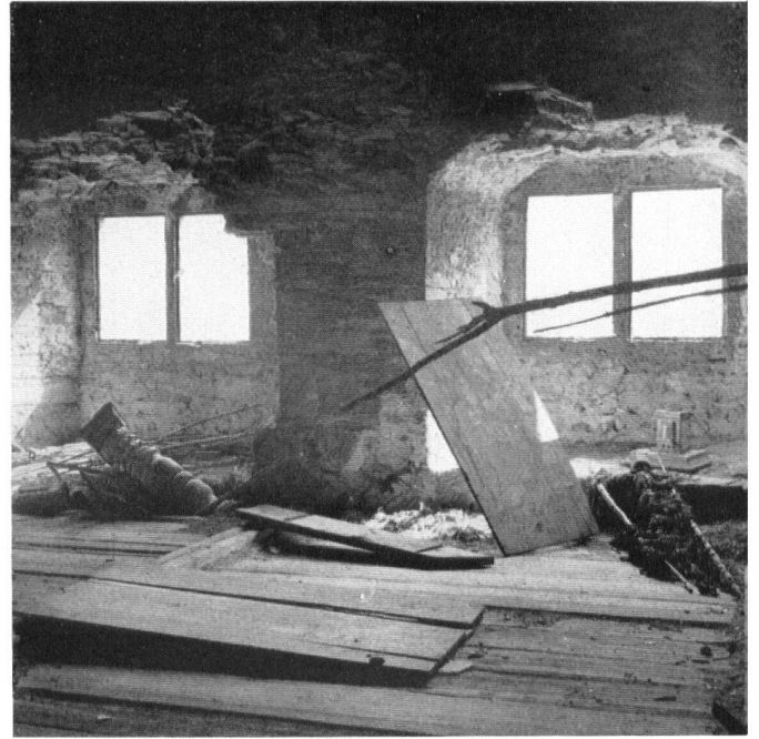
Raron. Das Eingangstor zum alten Rathaus, mit dem Stadtwappen. — Und so sieht es im Innern aus! A Rarogne où Rilke a choisi sa sépulture: la porte de l'hôtel de ville. L'intérieur n'en est pas mieux conservé. Raron. L'ingresso dell'antica Casa Comunale, con lo stemma civico. — Ed ecco lo spettacolo offerto dall'interno!

faire connaître les trésors de nos petites villes, que négligent souvent archéologues et architectes. Aucune revue de vulgarisation n'informe le grand public et le touriste passe, sans s'en douter, à côté des chefs-d'œuvre. La presse n'est pas à l'abri de tout reproche: elle fait une place généreuse au « Tour de Suisse » et aux chroniques judiciaires, mais pour les fresques carolingiennes de Müstair, récemment découvertes, quelques lignes en petits caractères suffisent.