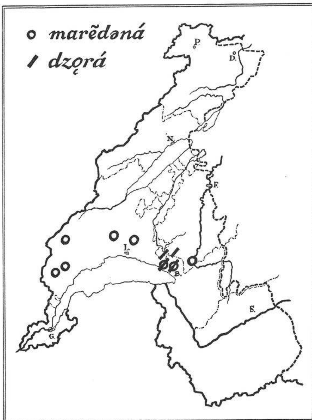
Carte n° 3