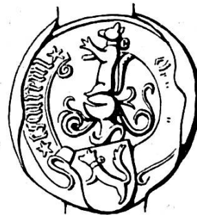
Fig. 3. Sceau de Jehan Lescureux le jeune, 1498.

Comme son père, il est un important notaire ; grâce à son sens avisé des affaires, il amasse une grosse fortune. Secrétaire de ville, receveur de Cerlier 14 , maire de La Neuveville cité dès 1487, il devint de plus châtelain du Schlossberg en 1496 et exerce cette magistrature jusqu'à sa mort. Cette nomination est confirmée en 1507 par l'évêque de Bâle, Christophe d'Utenheim. Le même souverain lui accorde deux ans plus tard un fief de deux muids de froment 15 . Jehan Lescureux est le premier bourgeois de La Neuveville à accéder à la charge de châtelain du Schlossberg. Son sceau porte un écureuil saillant au collier garni d'un grelot (Fig. 3).