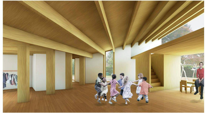
01+02 «Taka-Tuka»: Skulpturales Passstück mit viel Holz, Licht und Aussenbezug (Modellfotos: Jurybericht, Visualisierung: Hörler Architekten)

Gegenüber der Marienkirche in Zwingen BL soll ein Doppelkindergarten entstehen. Der Beitrag «Taka-Tuka» setzt dem dominanten Kirchenbau eine eigenständige Skulptur gegenüber. Der Entwurf überzeugt durch hohe aussenräumliche Qualitäten sowie sorgfältig gestaltete und folgerichtig organisierte Innenräume.