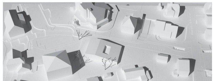
04 «Elmar»: Gefaltetes Dach