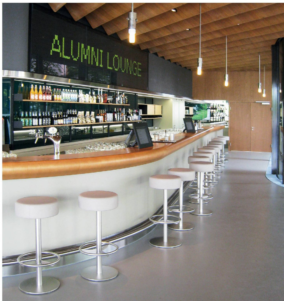
01 Die geschwungene Theke ist das Rückgrat der Lounge