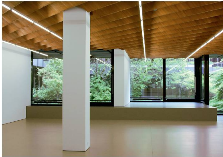
02 Die Oberflächen des neu gestalteten Ausstellungsbereichs sind analog zur Lounge materialisiert