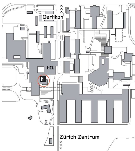
03 Situation Science City, rot eingekreist die neue Lounge

auf Dieter Rams «Regalsystem 606» von 1960 in mattschwarz eloxiertem Metall und Eichenholz.