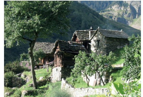
01 Rustici am Dorfrand von Madra im Val Malvaglia. Der Umbau von Rustici im Tessin erhält endlich eine gesetzliche Basis