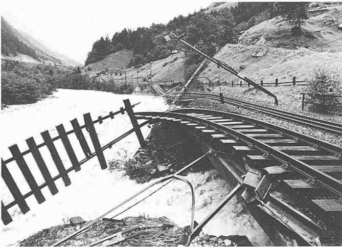
Verheerende Schäden richtete letztes Jahr die Reuss bei den Unwettern im Kanton Uri an. Bei Gurtellen wurden die Schienenstränge der SBB unterbrochen