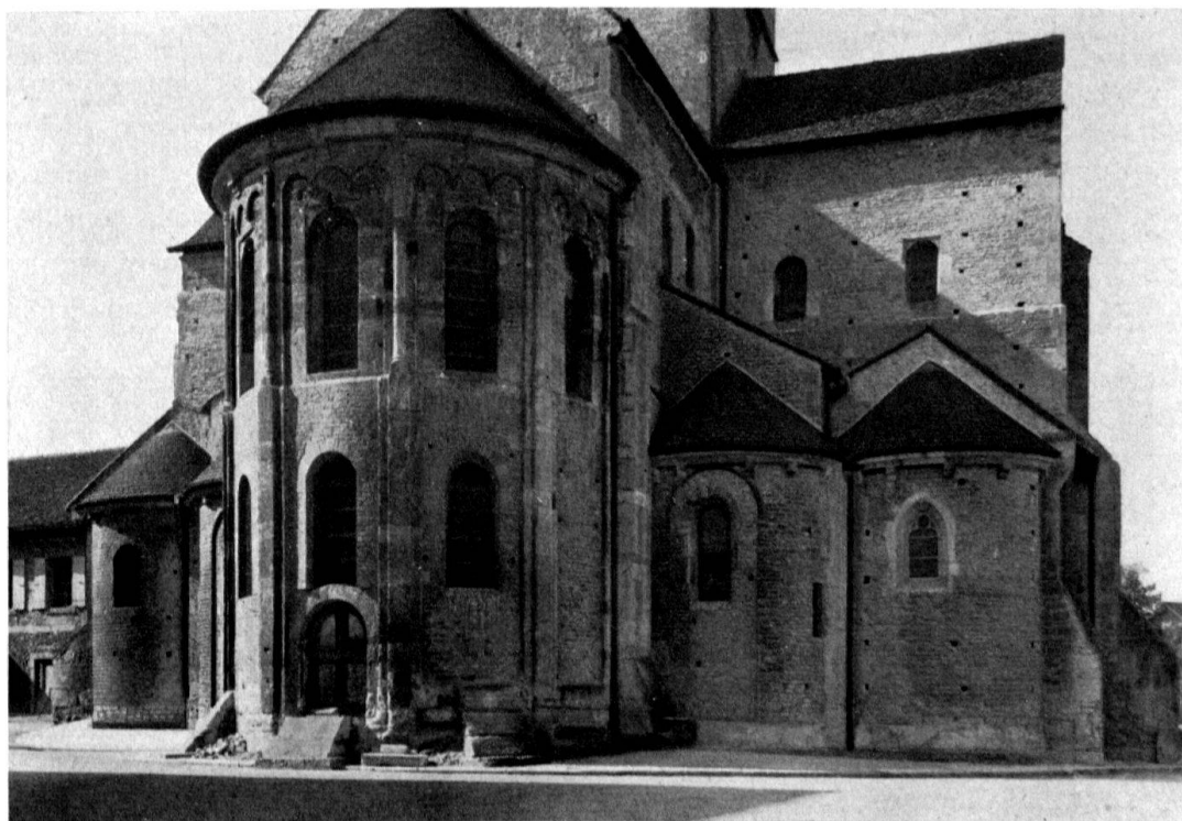
Payerne. Abbatale. Vue extérieure des parties orientales: chevet et transept

Prieuré clunisien de 1048 à 1484. Les bâtiments et leurs deux tours, transformés vers 1540, appartiennent au canton de Berne. L'église du XII e /XIII e siècle subsiste le transept avec la tour centrale; dans la façade de laquelle sont insérées deux colonnes corinthiennes d'Avenches.