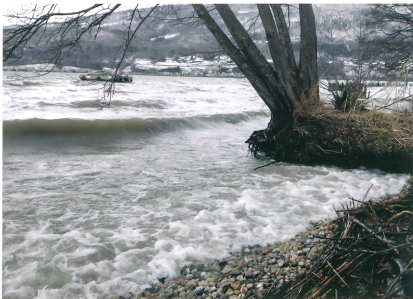
Abb. 1: Sutz-Lattrigen, Rütte. Bei Westwind laufen zerstörerische Wellen auf die Fundstelle auf.