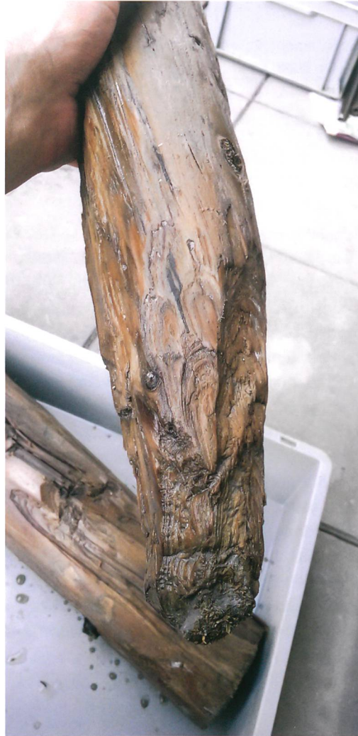
Abb. 7: Biel, Feldschlössliareal. Die Spitze eines 1,5 m langen Pfahls ist mit dem Steinbeil bearbeitet.

Unter den neuzeitlichen Strukturen liegen in grosser Tiefe prähistorische Siedlungsreste. Sie belegen sehr schön, dass dieses Areal im 39. Jahrhundert v. Chr. und vermutlich weit darüber hinaus im Uferbereich des Sees lag. Eine archäologische Untersuchung der sondierten Flächen wird neue Erkenntnisse über die Zeit des frühen Cortaillods liefern.