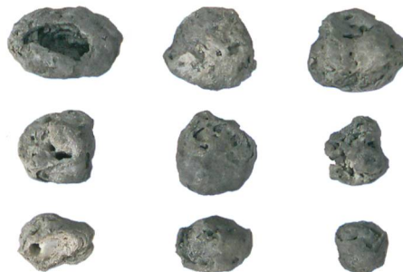
Abb. 3: Biel, Feldschlössliareal. Onkoiden aus der archäologischen Fundschicht. M. 1:2.