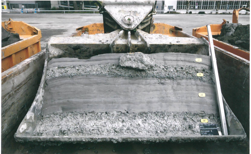
Abb. 4: Biel, Feldschlössli-areal. Baggerschaufel mit der archäologischen Fundschicht zwischen gebänderten Tonpaketen. Der grosse Bruchstein ist ein deutlicher Hinweis auf menschliche Aktivität.

noch in eingeschränktem Mass vorhanden. Alle stabileren Materialien wie Holz, Keramik, Knochen und Stein blieben aber erhalten. Wir sprechen in einem solchen Fall von einem Reduktionshorizont.