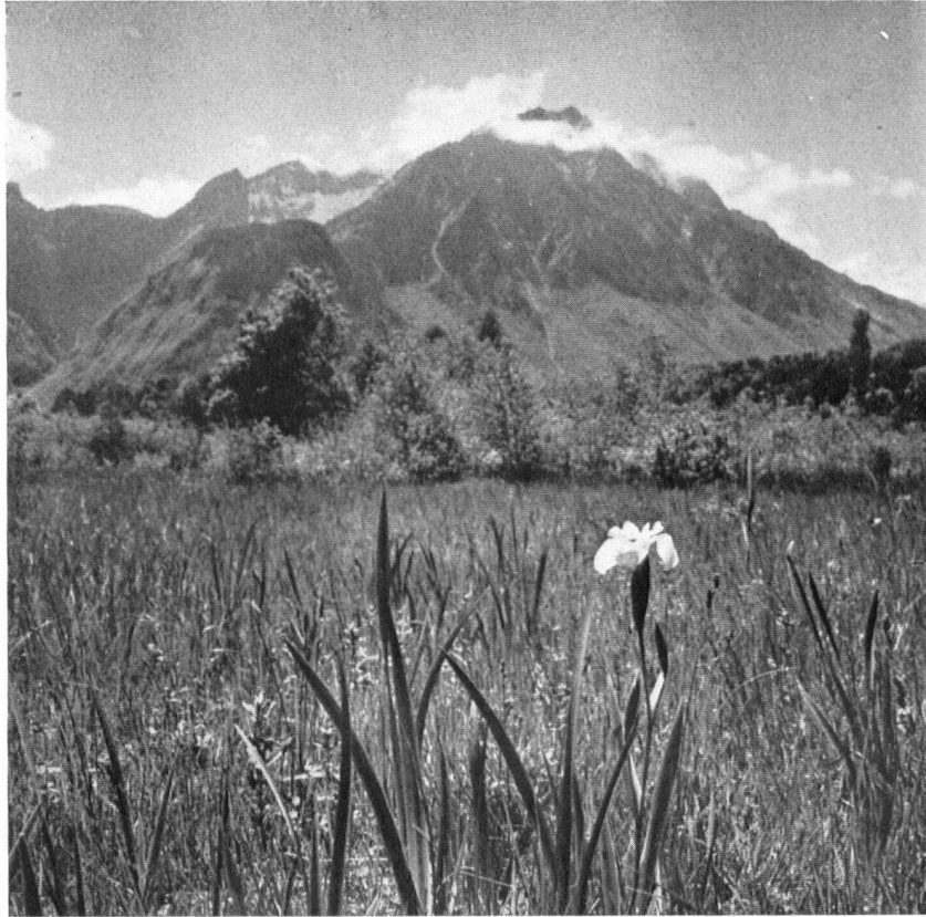
Ein Ausschnitt aus dem Vogelschutzgebiet (Réserve des Grangettes) mit Blick gegen den Grammont. Die Reichhaltigkeit an Vogelarten hat nicht leicht ihresgleichen in der Schweiz. La réserve des Grangettes, au pied du Grammont. Par le nombre et la variété des oiseaux, elle n'a pas sa pareille dans toute la Suisse.

adhésion enthousiaste au projet. Mais il arrive souvent, en Suisse, que le peuple fait preuve de plus de bon sens et de pondération que ses représentants élus. Une pétition, couverte en trois semaines de plus de 13 000 signatures, demande au Conseil d'Etat de refuser l'autorisation de construire un aéroport en ce lieu. Elle a été appuyée par la Ligue suisse pour la Protection de la nature, la Commission vaudoise pour la protection de la nature, la Société romande pour l'étude et la protection des oiseaux, la Société mycologique vaudoise, la Société vaudoise d'Entomologie, le Cercle vaudois de Botanique, la Société d'Etudes artistiques, le Cercle ornithologique de Vevey-Montreux.