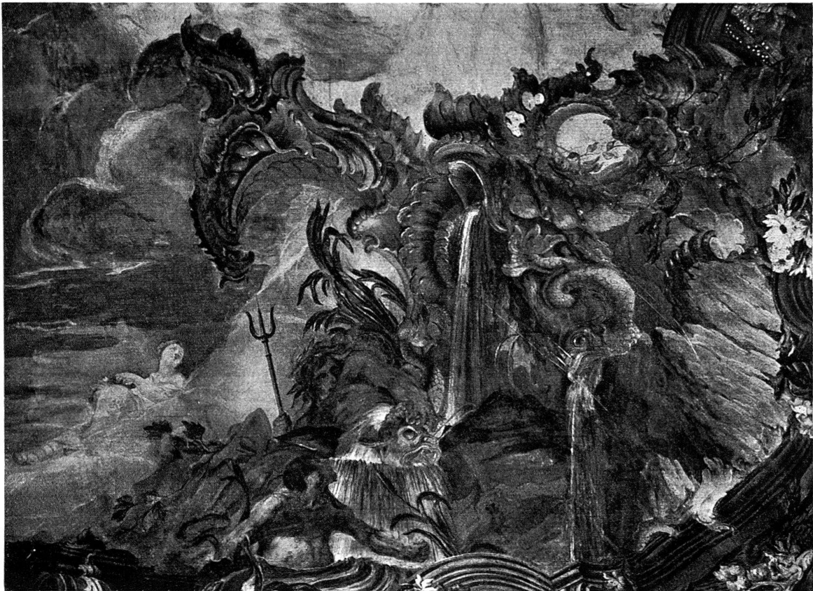
Abb. 3. Schloß Meersburg, Treppenhaus. Flußgott, Neptun, Fische, Drachen. Fresko von G. Appiani