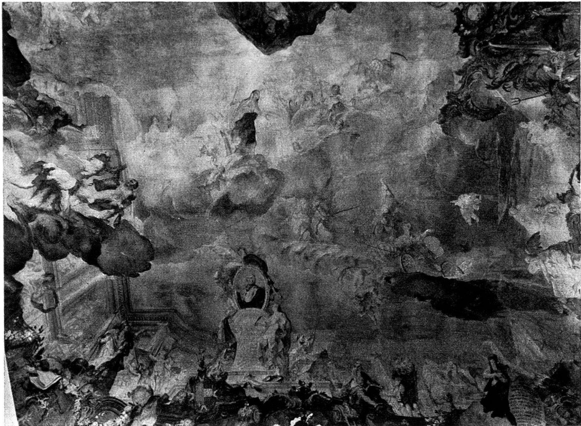
Abb. 2. Schloß Meersburg, Treppenhaus. Verherrlichung Kardinal von Rodts. Fresko von G. Appiani

Links davon hält ein Putto unter dem Hermelinmantel den Bischofsstab, während rechts eine über offenen und geschlossenen Büchern stehende Frau mit der Feder in der Hand als Klio, Muse der Geschichtsschreibung, die Taten des Herrschers aufschreibt. Weiter unten links halten zwei Löwen das Wappen mit Malteserkreuz und Helmzier. Die linke Ecke bestimmt Pallas Athena – mit Helm und Lanze auf den Fürstenweisend, umgeben von Frauengruppen und Putten mit den Emblemen der Künste. Zu erkennen sind die Musik mit Trompete, die Malerei mit Staffelei, Pinsel und Palette, die Bildhauerei mit Hammer und Spitzeisen, die Mathematik mit Zahlen, die Geographie mit der Weltkugel, die Architektur mit Planentwürfen für das neue Schloß, Philosophie, Dichtkunst und Naturwissenschaften mit Frauengruppen (Abb. 4).