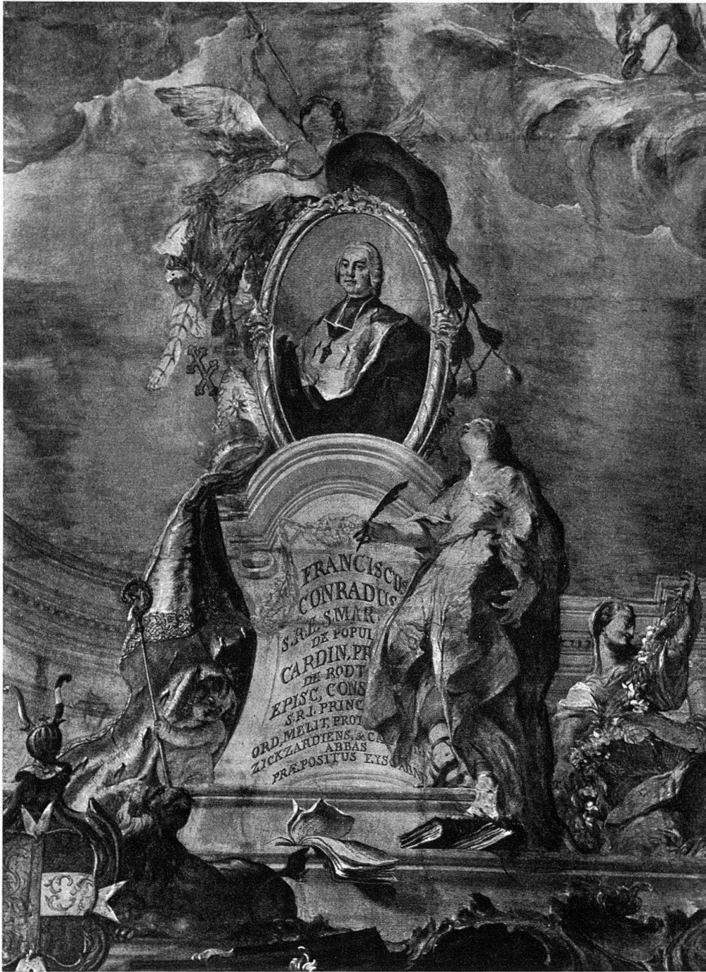
Abb. 4. Schloß Meersburg, Treppenhaus. Kardinal von Rodt. Fresko von G. Appiani

Diagonalbahn unter die Herkules-Diagonale, endet über dem Herrscherporträt und wird von den sich aufbäumenden Pferden auf das Niveau von Psyche gehoben. Psyche selbst wird zum zweiten Knotenpunkt, indem sie als Teil der Querachse die Diagonalen kunstvoll miteinander verknüpft und zum Halbkreis der Götterversammlung leitet.