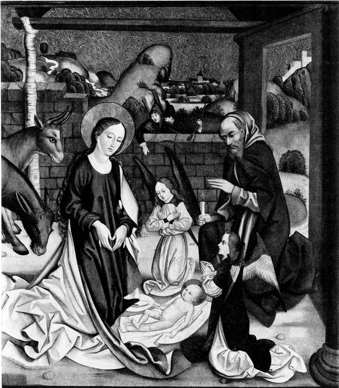
Abb. 3. Geburt Christi, Rückseite von Abb. 2

der Sammlung Forrer einem Luzerner Meister zusprach 5 . Die Beschneidung bestätigt nun unsere früheren Überlegungen, indem sie in Stil und Technik auch mit den Flügelbildern des Konstanzer Meisters in bishöflichen Besitz St. Gallen übereingehen 6 . Wieder treffen wir die gemessenen, behutsamen Bewegungen der Figuren und den Willen zu einer sorgfältig ausgewogenen Komposition mit rahmenden Elementen. Die bunte Koloristik der St.-Galler Flügelbilder kehrt in den lauten Lokalfarben der Beschneidung wieder, wo das leuchtende Rot der Gewänder der Dienerin und des Hohepriesters mit dem Azuritblau