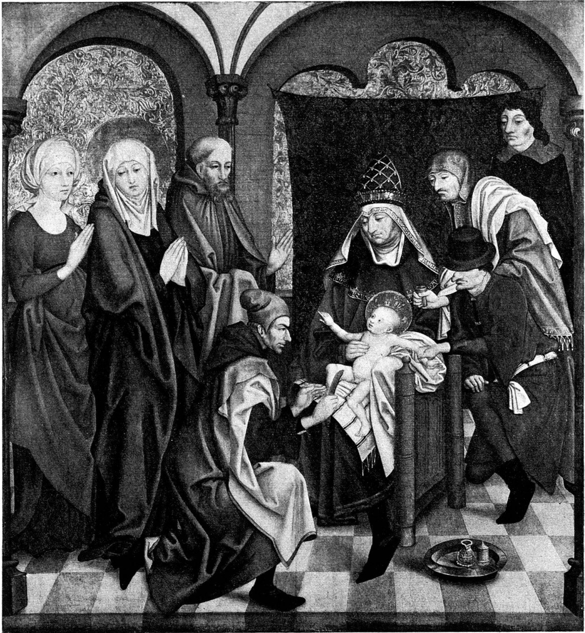
Abb. 1. Beschneidung Christi, Holz, 136,5 × 124 cm, Staatsgalerie Stuttgart

rienleben, was durch das Auftauchen der Beschneidung als eine der sieben Schmerzen Mariä Bestätigung findet. In unserer Vorstellung stand bei geöffnetem Altar die Geburt links oben, da ihre Goldranken am obern Rand auf halber Höhe abbrechen und deshalb ein heute verlorener Aufsatz vorausgesetzt werden muß 4 . Die Beschneidung bietet keine stilistischen oder technischen Anhaltspunkte für eine spätere Verstümmelung und gehört damit in die untere Reihe der Marienszenen, wo sie sich auf der linken Seite, unter der Geburt , einfügt (Abb. 6). Der Platz rechts unten kommt aus ikonographischen Gründen nicht in Frage; diese Tafel zeigte wohl die Darstellung im Tempel oder den Mariantod . Die einst mit der Beschneidung zusammenhängende Rückseite müßte nach der Rekonstruktion