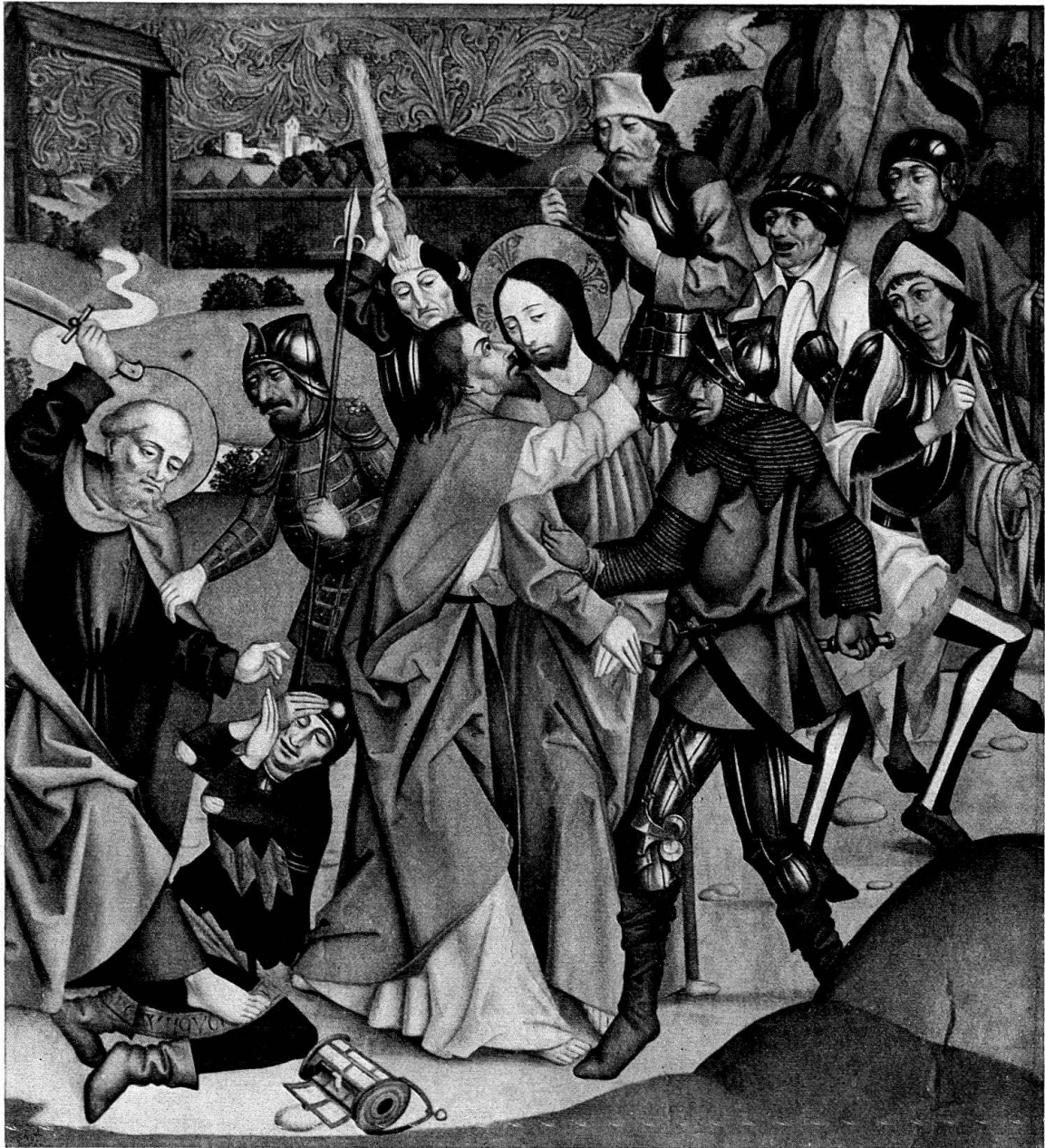
Abb. 2. Gefangennahme Christi, Holz, 138 × 127 cm, Sammlung Berg, Frankfurt a. M.

eine Passionsszene, nach unserer Annahme Ecce Homo darstellen. Daß die Tafeln zum Teil schon früh getrennt worden sind, beweist das Fragment Christus vor Pilatus , das auf der verlorenen Rückseite wohl die Anbetung der Könige zeigte. Nach wie vor kennen wir weder die Szenen des Altars in ganz geschlossenem Zustand noch die Zusammensetzung des Schreins selbst, wo die Muttergottes mit Heiligen , wenn nicht eine Marienkrönung vermutet werden darf.