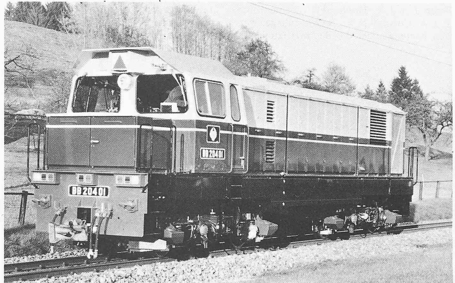
Die neue Zahnrad- und Adhäsionslokomotive HGm 4/6 auf Testfahrt auf einem Streckenabschnitt der Appenzellerbahn (Schweiz)

sumatra eingesetzt werden. Auf dieser Linie wird hauptsächlich Kohle transportiert, die maximale Steigung beträgt dabei 72‰, die