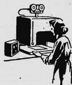
Lumprint MT 3/16 Microfilmcamara für 16 mm Film für Standard und Duo Aufnahme mit 22 und 32 facher Verkleinerung, Automatische Belichtungsregelung.