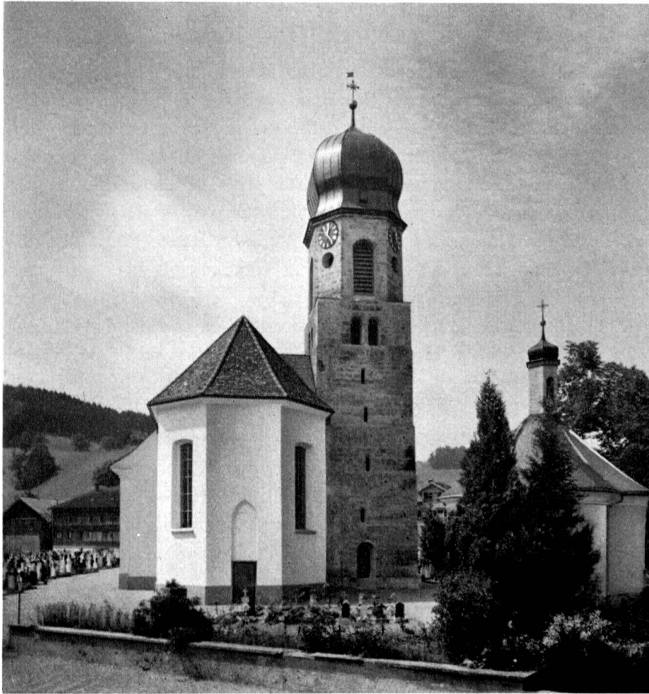
Ansicht der Kirche in Mosnang von Osten gesehen

Die Pfarrkirche von Sarnen liegt ein gutes Stück vom Hauptort Obwaldens entfernt; sie ist ein bedeutendes Werk der Luzerner Meister Singer. Im Dorf selber wurde schon 1556 eine Kapelle errichtet, woran noch jetzt ein spätgotisches Stifterwappen erinnert, das in den vergrößerten Neubau von 1662 übernommen wurde. Mit Ausnahme einer Intarsienkanzel stammt die Ausstattung jedoch aus dem Rokoko. Bei der schon längst fälligen Restaurierung, die wiederum mit Bundeshilfe ermöglicht wurde, kehrten zahlreiche Ausstattungsstücke in die Kapelle zurück. Da sich am Landgemeindesonntag von ihr aus der feierliche Zug auf den Landenberg formiert und am Schlusse jeweilen in der Kapelle ein kleiner Dankgottesdienst stattfindet, setzten wir an die südliche Chorwand die Wappen aller Landammänner Obwaldens, beginnend mit Rudolf von Oedisried 1304; für die Fortsetzung der stolzen Reihe ist genügend Platz vorgesehen. Die recht schwierig auszuführenden heraldischen Malereien sind von Paul Diethelm in Kastanienbaum. Von den Ausstattungsstücken verdient das Giebelbild des Hochaltars besondere Beachtung, da es sich um eine signierte Arbeit des Augsburger Spätrenaissancemalers Mathias Kager (1566–1634) handelt. Dem lokalen Architekten, F. Stockmann-Ettlin, standen als künstlerische Berater der nidwaldnerische Denkmalpfleger Alois Hediger und der Schreibende zur Seite.