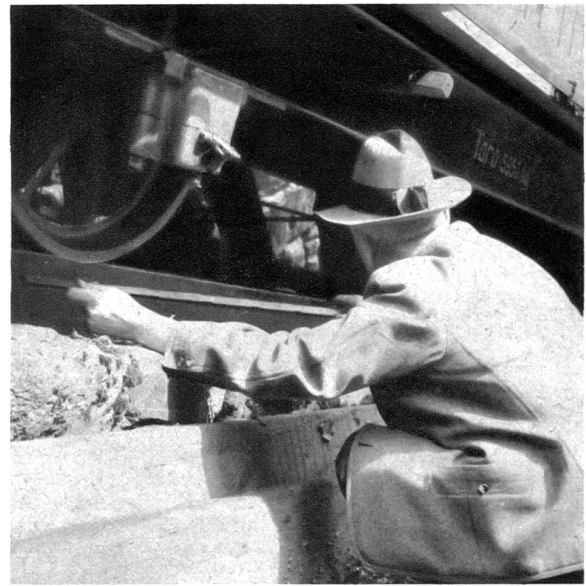
Der Bremsweg wird gemessen

Jeden Haltes bar saust der Wagen in die Tiefe; aber grossartige Bremsvorrichtungen verhindern einen langen Lauf. Nach vierzig bis sechzig Centimeter stoppt der schwer belastete Wagen