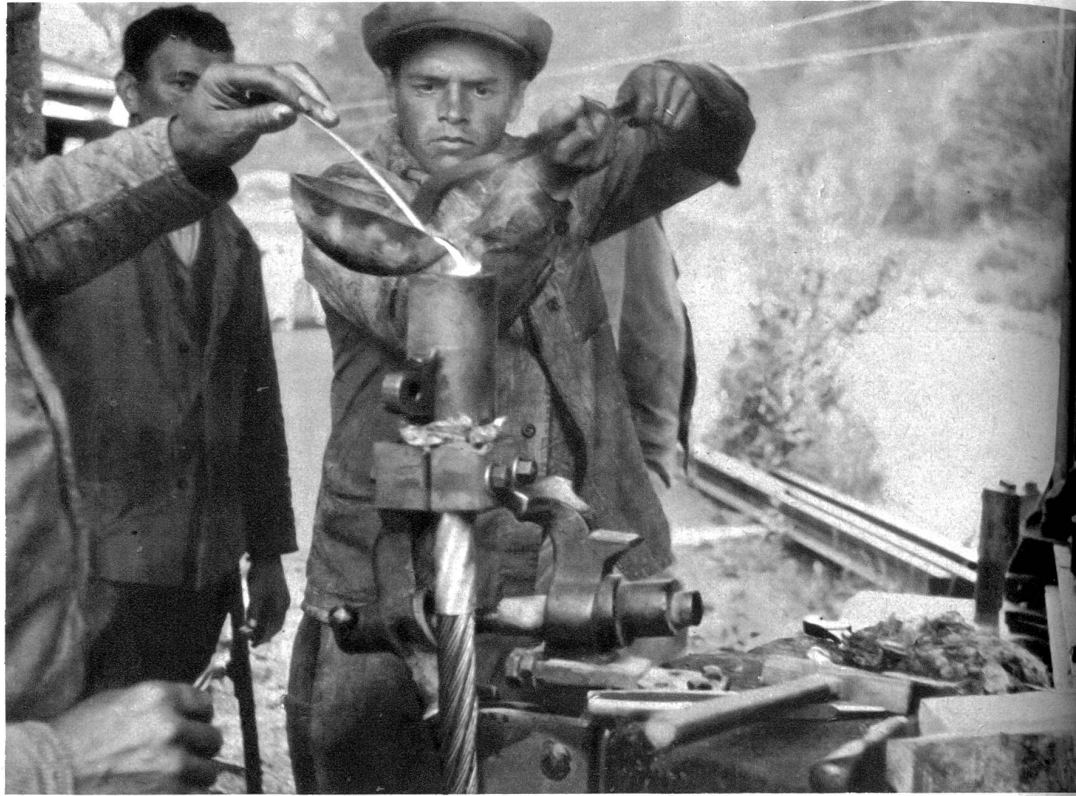
Der Seilkopf wird ausgegossen

macht und den großen Strom der Reisenden auf sie hingezogen. Der Schar der auserwählten Kletterer in Fels und Firn ist immer noch ein ungeheures Gebiet für ihre Taten geblieben.