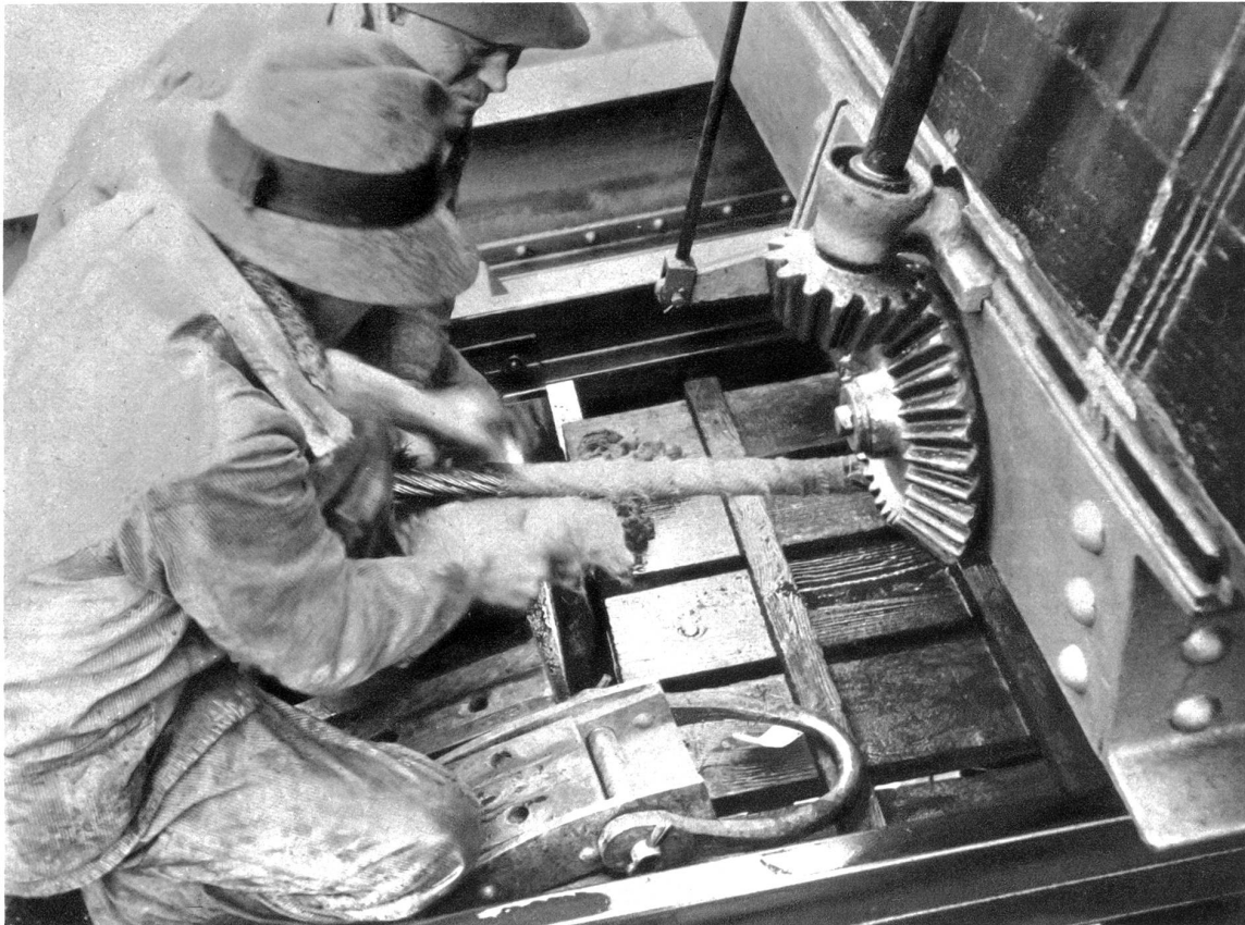
Das Seil wird im Wagen fest eingeklamert

bahnen anvertrauen. Getroßt! Da dürfen Sie immer fahren, denn es wird in der Schweiz das Meüßerste getan, um sicher und schnell fahren zu können, und gerade bei den Bergbahnen ist die Kontrolle eine große und ausgedehnte. So werden einmal die Seile bei den Drahtseilbahnen einer sehr genauen Prüfung unterzogen und mehr noch — müssen oft ausgewechselt