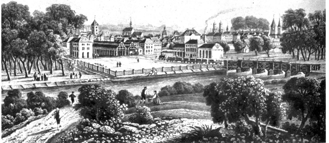
Erster Bahnhof Zürich, aus dem Jahr 1847