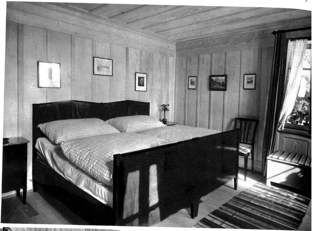
Biedermeier-Schlafzimmer in Nussbaum, matt poliert