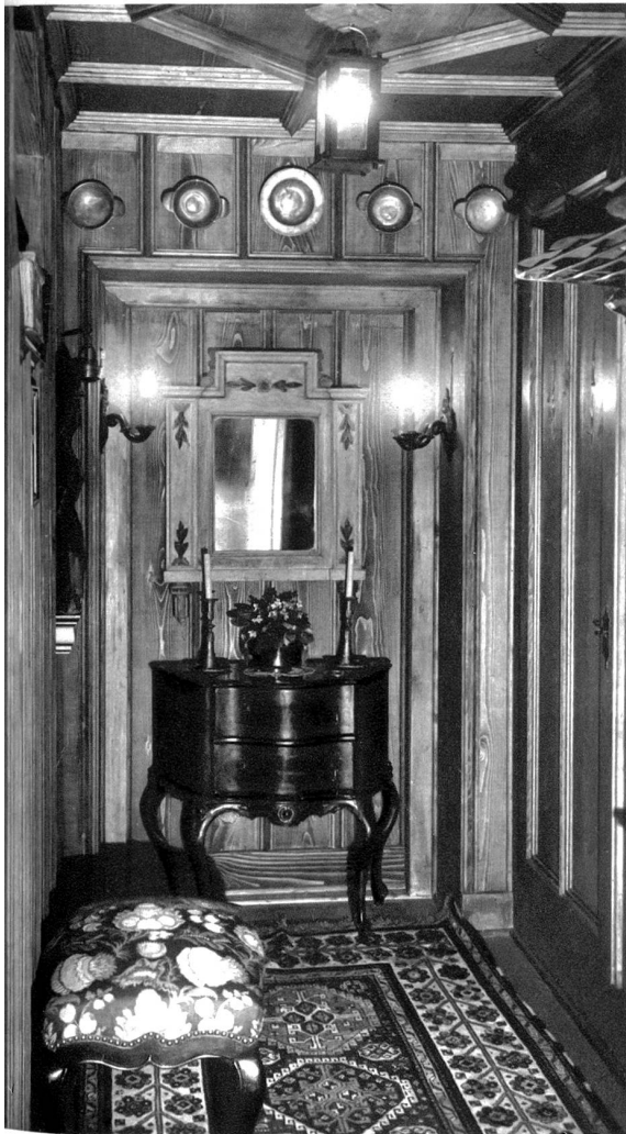
Das „Entrée“ getäfert, im Privathaus Dr. Sch.

Eine Wandlung im Stil des Wohnzimmers hat sich in den letzten Jahren vollzogen. Der Zug nach Weiträumigkeit hat zur Flucht aus den Möbeln veranlaßt. Weite muß sein, Raumgefühl. Jedes nicht absolut notwendige Möbel wird ver-