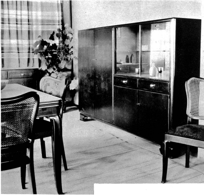
Esszimmer in Nussbaum-Wurzelmaser, bestehend aus: Geschir- und Wäscheschrank, Kredenz, Auszugstisch, Stühle mit Polstersitz und Jone-Rücken.