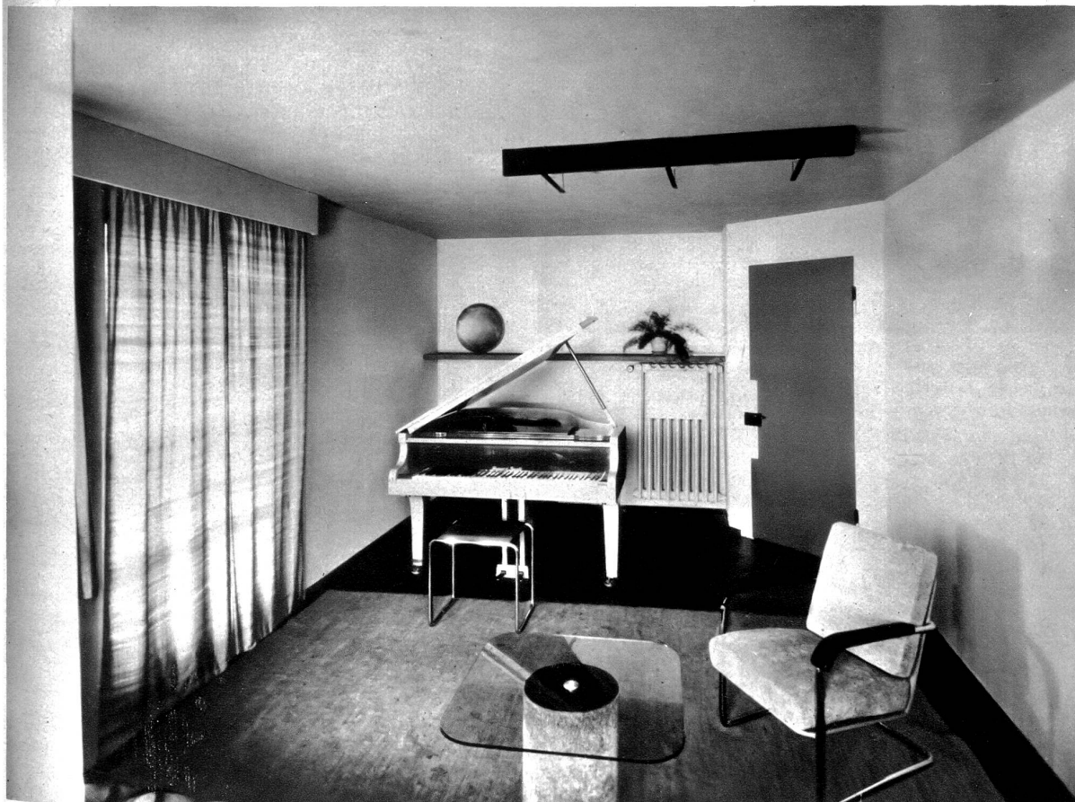
Musikzimmer des Herrn A. jun. in Langenthal. Zum Teil in Spritzlack, Boden mit Velourteppich