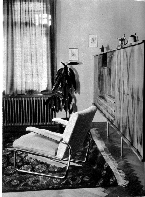
Herren-Wohnzimmer des Herrn B. in Langenthal