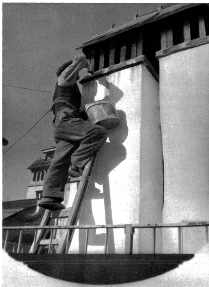
Auf wankendem Steg muss am hohen Kamin der Mörtel angebracht werden