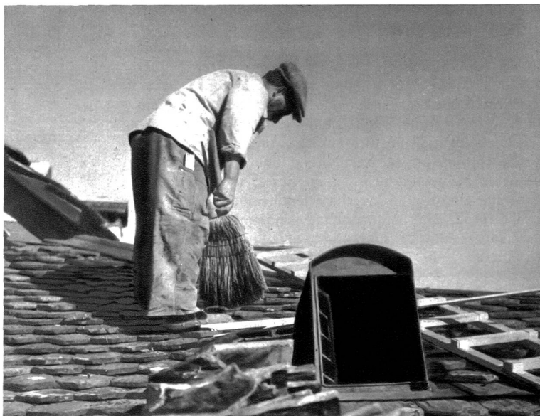
Nicht immer sind die Dächer so flach!