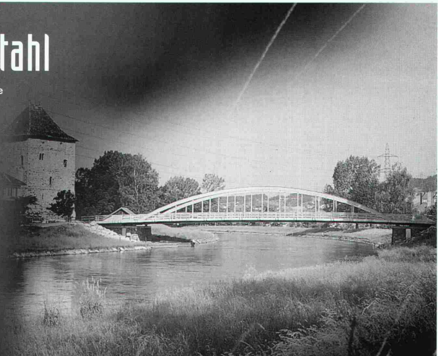
Brückenschlag über die Linth

Stahl als Alternative zu Beton – 50 Meter lange und 6 Meter hohe Seitenteile als vorgefertigte Elemente dienen für den spektakulären Brückenbau bei Grinau. Die Bogenbrücke mit vorgespannten Betonplatten gilt als Wegweiser im modernen Brückenbau und zeigt eine Symbiose aus Stahl und Beton, die für ein Höchstmass an Sicherheit und Lebensdauer garantiert.