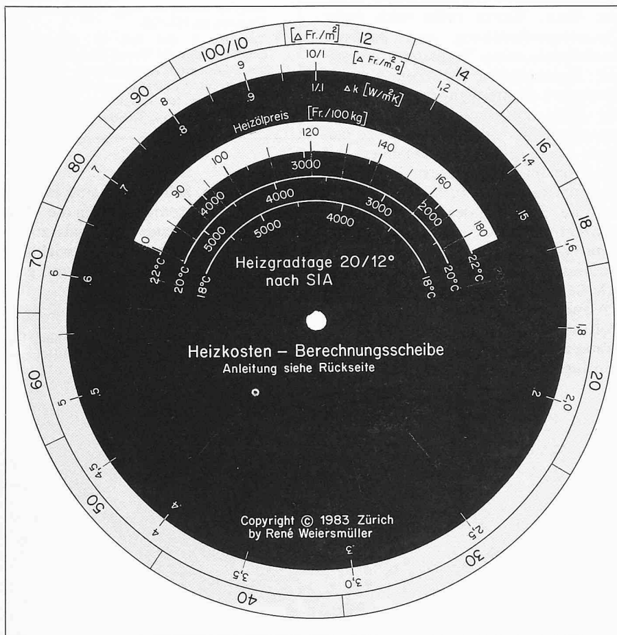
Bild 1. Vorderansicht der HK-Scheibe

Wird die Heizanlage erst bei Erreichen einer Aussentemperatur von 14 °C eingeschaltet, muss demnach durch den Anteil Sonnenenergie plus innere Abwärme die Differenz auf die 20 °C Raumlufttemperatur gedeckt werden. Dieser Anteil dürfte im Mittelland Ende Dezember/Anfang Januar den Tiefstwert von noch rund einem Drittel des Wertes wie in der Nähe der Heizgrenze erreichen, d.h. für die Berechnung der absoluten Verluste eines Bauteils müssen die auf eine Heizgrenze von 14 °C umgerechneten Heizgradtage 20/12 °C um durchschnittlich 4 °C vermindert werden. Dies gilt allerdings nur, wenn die zusätzlichen Wärmege- winne aus Sonneneinstrahlung durch die transparenten Bauteile und die inneren Abwärmern gleichmässig allen