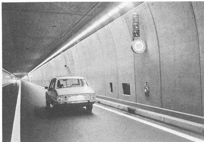
Bild 2. Beleuchtung der Mittelzone

Obwohl der Gotthard-Strassentunnel mit einer äusserst zuverlässigen Energieversorgung ausgestattet ist, muss mit zeitweiligen Spannungsunterbrüchen gerechnet werden. Sie können sowohl den ganzen Tunnel umfassen, als auch partiell , infolge eines Defektes in der tunnelinternen Verteilung, auftreten. Diese Unterbrüche bewirken einen Ausfall der Tunnelbeleuchtung und damit verbunden eine plötzliche Reduktion der Sichtweite. Bei einem Fahrzeuglenker kann dies zu Fehlreaktionen und als Folge davon zu einem Unfall führen. Nebst Fahrzeugen, die wenigstens mit einer eigenen Beleuchtung ausgestattet sind, die bei der Durchfahrt eingeschaltet ist, muss im Tunnel mit Fussgängern ( Pannenfahrzeuge ) gerechnet werden. Um diese Gefahrenquellen auszuschalten, ist der Tunnel mit einer Notbeleuchtung versehen. Sie ist in die Normalbeleuchtung integriert, so dass keine speziellen Notleuchten installiert werden mussten. Jede zehnte Leuchte der Fluoreszenzbeleuchtung wird dauernd von einem Wechselrichter gespeist. Bei vorhandenem Netz erhält der Wechselrich-