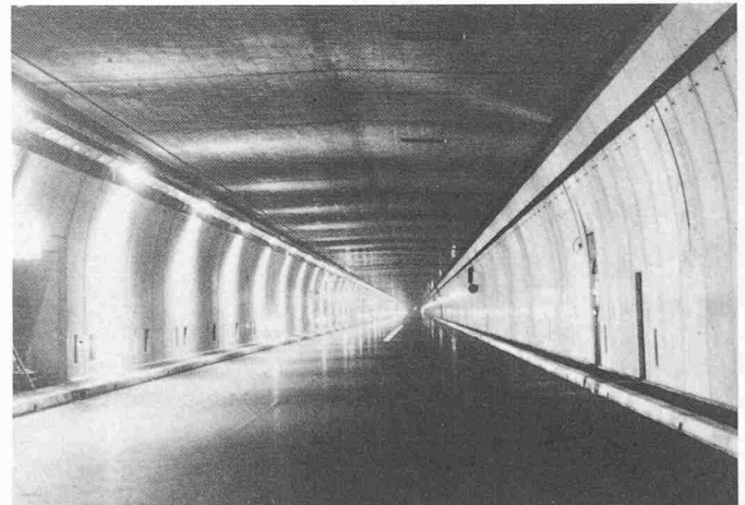
Bild 3. Notbeleuchtung mit eingeschalteter Brandnotbeleuchtung