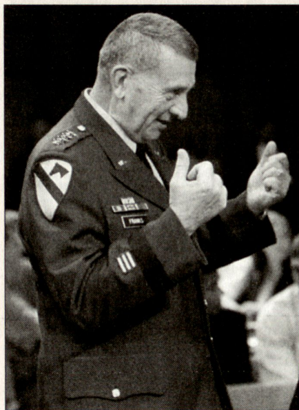
General Tommy Franks (1945), Kommandant der Operation IRAQI FREEDOM.

Weitere Ereignisse entsprechen überhaupt nicht den Annahmen: Die im Irak einmarschierenden Truppen werden nicht als Befreier begrüsst, der eigentliche mili-