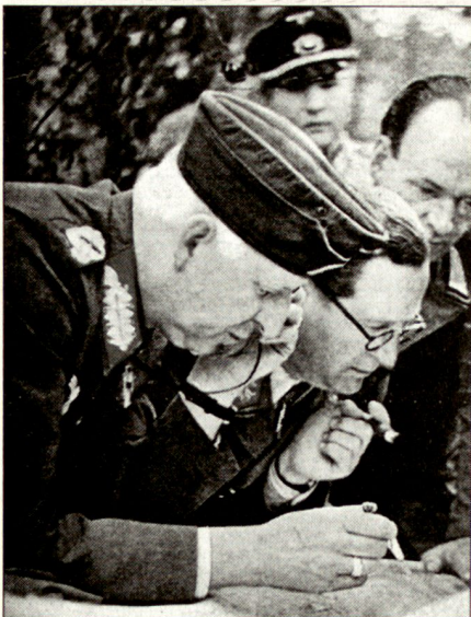
Generalfeldmarschall Erich von Manstein (1887–1973) beim Kartenstudium.

Das Oberkommando des Heeres (OKH) hatte mit der Aufmarschanweisung GELB vom Oktober 1939 von der Idee her eine Wiederholung des Schlieffenplanes angeordnet. Mit einem starken rechten Flügel, der über Holland bis an die Küste ausholt, sollten die bereitstehenden französischen und englischen Truppen umfasst und vernichtet werden. Die Ziele der Offensive waren: Vernichten der alliierten Streitkräfte, gewinnen von Raum in Holland, Belgien und Nordfrankreich als Basis für den Krieg gegen England sowie Besetzen eines weiten Vorfelds vor dem lebenswichtigen Ruhrgebiet.