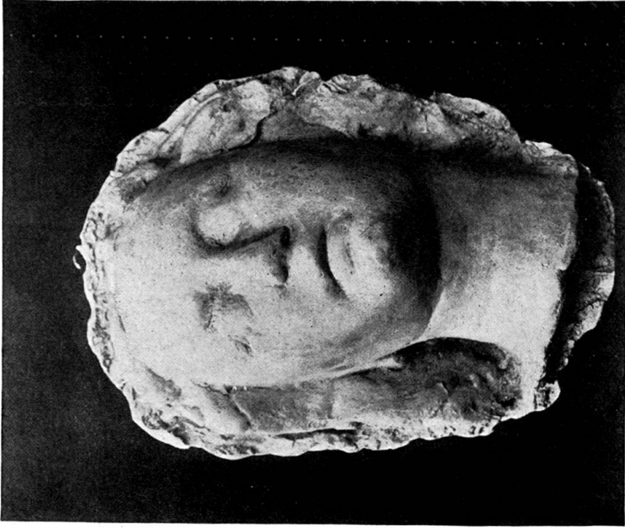
3. Kopf von der St. Leonhardskirche in Basel.