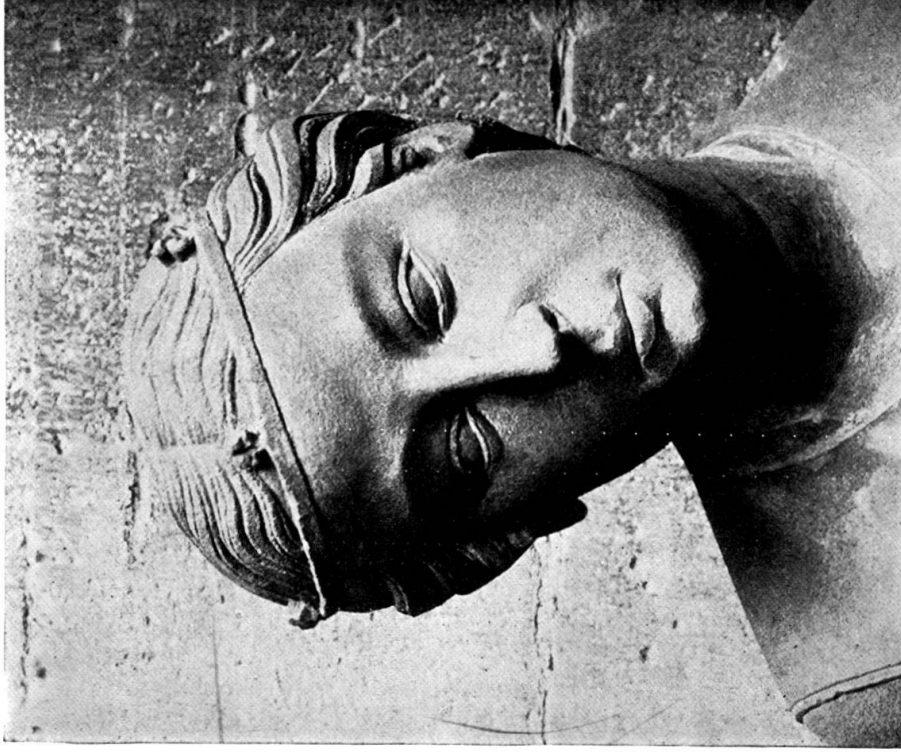
4. Kopf einer tönichten Jungfrau am Strassburger Münster.