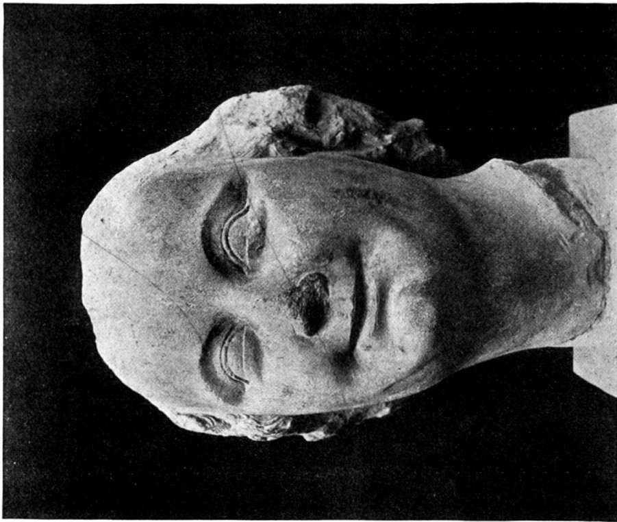
2. Kopf aus dem Basler Historischen Museum.