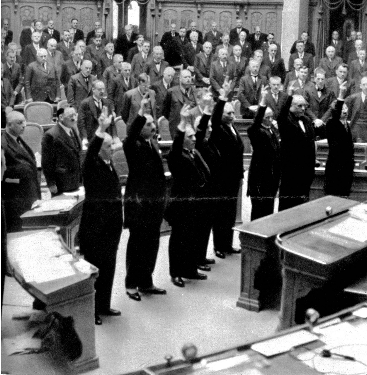
Der Schwur der sieben Bundesräte und des Kanzlers auf die Verfassung

Davon merkt man eigentlich außerhalb dem Bundespalais herzlich wenig. In den heimeligen Lauben Berns begegnet man zwar hin und wieder mal einem oder einem Trüpplein Räte, und der Eingeweihte weiß natürlich sehr gut, wo er zwischen den Sitzungen unsere Landesväter findet, werden doch immer gewisse Lokale und Restaurants bevorzugt. Steckt man aber seine Gwundernase in die Ratsäle hinein, so bekommt man