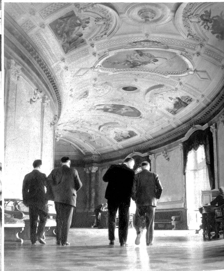
Die Wandelhalle, der stille Schauplatz der politischen Promenade

die einen sitzen, andere stehen herum, sei's um näher dem Sprecher zu sein, sei's um abseits den Verhandlungen zu folgen. Von der Saaltribüne aus kann der Bürger beobachten, hören und sehen. Und wer Augen hat zu sehen und Ohren zu hören, für den ist so ein Parlamentsbetrieb oftmals beinahe so etwas wie eine Offenbarung. Man lernt und — versteht. Aber der Schweizer weiß, daß seine obersten Räte alles Lob verdienen, und daß es nicht recht wäre, wenn man immer nur kritisieren würde. Und schließlich: nicht jeder kann Landesvater sein. Es muß ja auch Landesfinder geben.