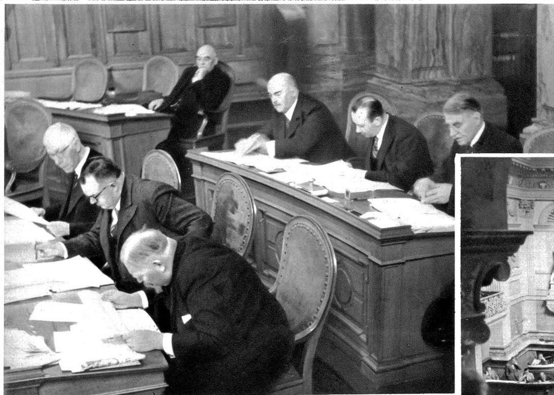
Blick in eine Ecke des Ständeratssaales