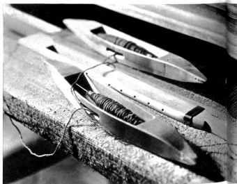
Die „fährigen“ Geister des Webstuhles, die Schiffchen

Arbeiten zuzuge gebracht. Längst wird das „Stiefel“, wie der Webstuhl in unsern Bergen heißt, nicht mehr für den Selbstgebrauch allein gebraucht, nein, man trachtet darnach, durch die geübte und solide Hand- und Kunstarbeit die maschinellen Teppiche und Vorhänge zu verdrängen. Und wer einmal die feinen, künstlerisch hochwertigen Muster betrachtet hat, der wird daran seine helle Freude finden. Hier ist's ein schmuder Vorleger, da der Leberzug zu einem Kissen, hier ein originelles Tischstuch, das uns entzückt, in jenem