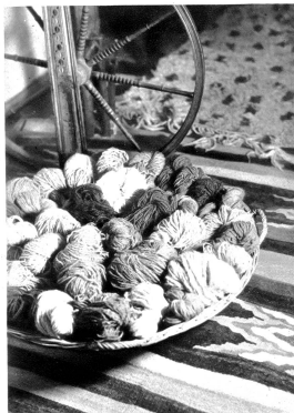
Wolle — Ausgangsstoff für die schmucken Webarbeiten

Zimmer sind's die Vorhänge und sieb' nur an; selbst die dicken Kleider der Hausfrau sind aus handgewebten Stoffen hergestellt.