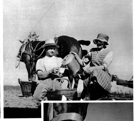
... und dann trinkt man in der Ruhepause mit Belegen den duftenden Milchkaffee