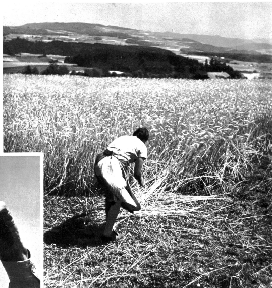
Wiederum rauschen auf dem Lande draussen die reifen Aehrenfelder