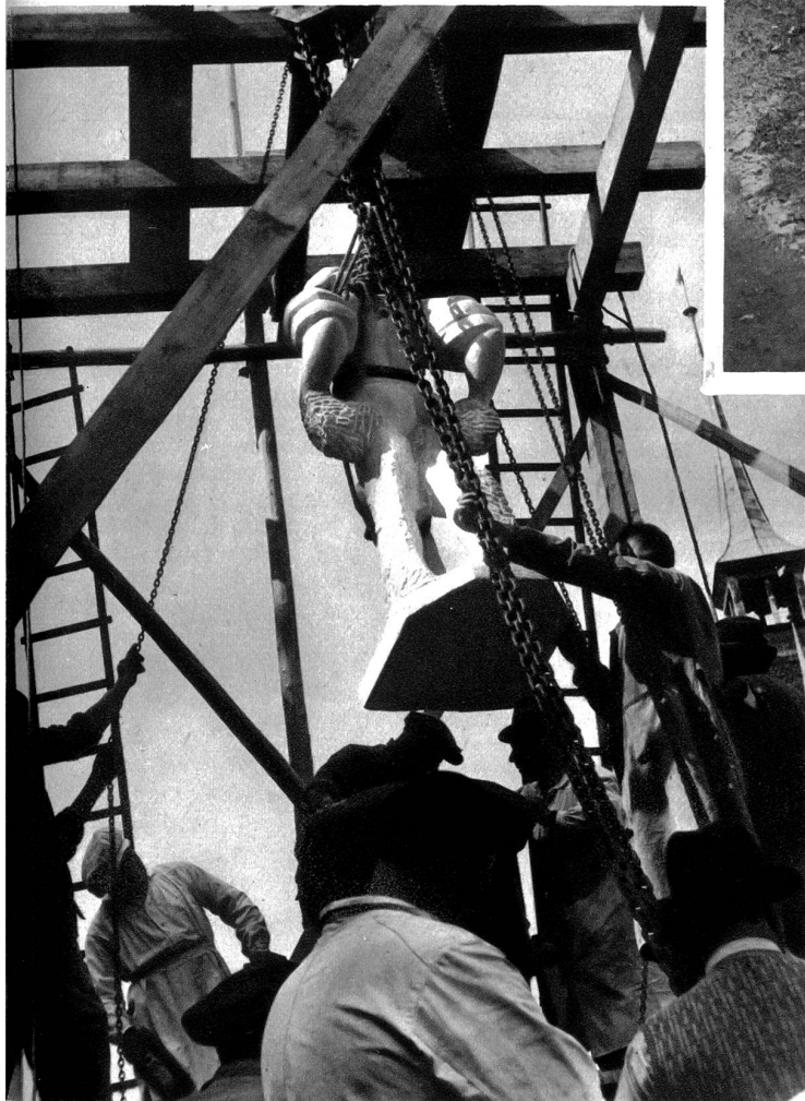
Keine amerikanische Negerexekution, sondern hier wird der Landsknecht mittelst dem Flaschenzug auf den Brunnensockel gezogen