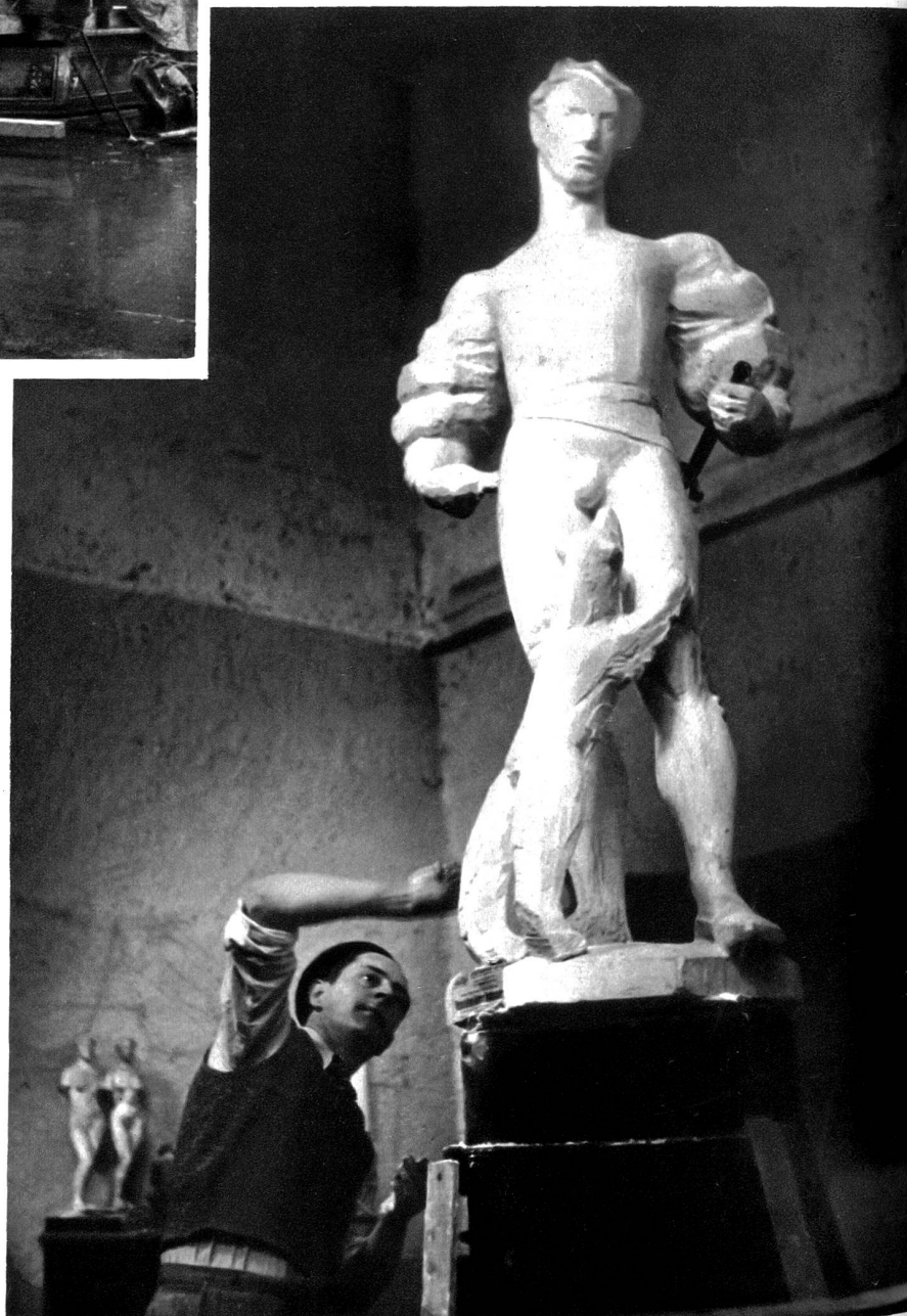
Mit einem Bären an der Kette, so sagt die alte Chronik, sollen zwei Trupp Berner Landsknechte aus der Schlacht von Navarra heimgekommen sein. Bildhauer Walter Linck hat so einen Krieger in Gips geformt und in Stein gehauen