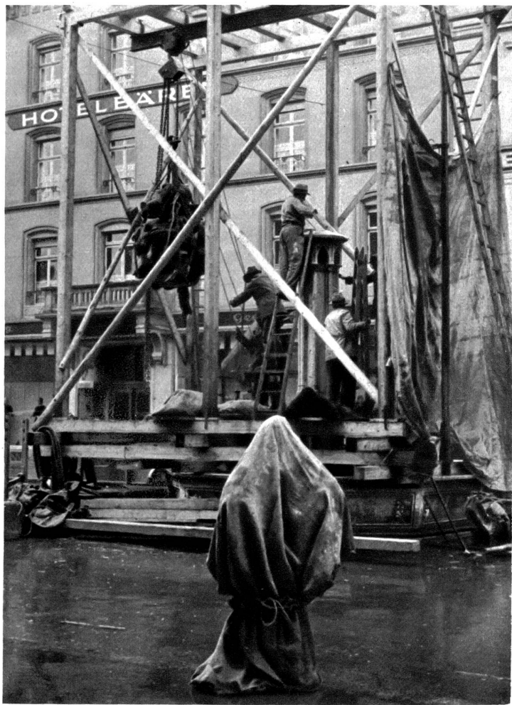
Die alte Brunnenfigur, die ringenden Bären werden entfernt