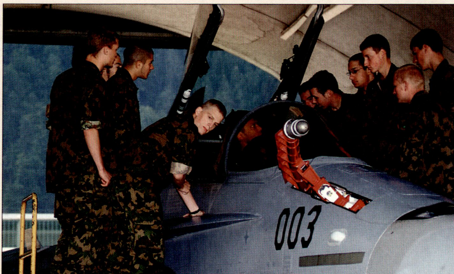
Teilnehmer Of LG 1-05 am LW-Ausbildungstag.

Der in Europa klar erkennbare Trend, dass aus finanziellen Gründen kein Staat mehr alleine eine hochtechnische, teure Luftwaffe betreiben kann und daher die multinationale Zusammenarbeit mit befreundeten Staaten gesucht wird, zwingt uns, die noch bei vielen Schweizern unbe-