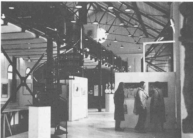
Blick in eine Ausstellungshalle

Die Umgestaltung einer alten Militär-Reithalle in ein Museum für zeitgenössische Kunst brachte den Kieler Archi-