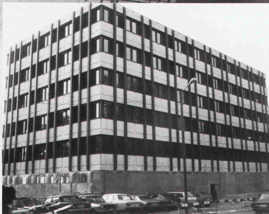
Verwaltungs- und Geschäftsgebäude der Publicitas AG, Lausanne. Dieses Bauvorhaben war bei der WAADT versichert.