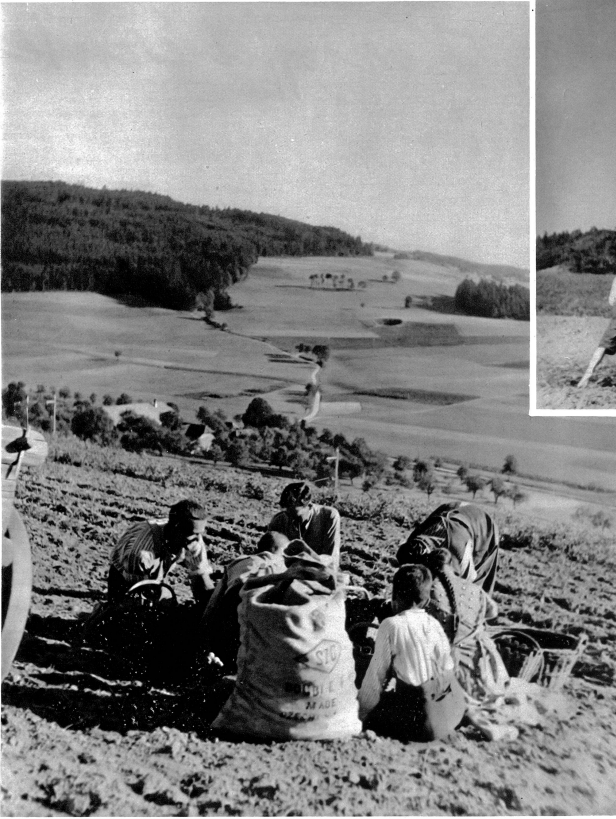
Ab und zu wird es einem vollen Sack schwindlig und er übergibt seinen Mageninhalt wieder der Erde, dann muss die Sache wieder in Ordnung gebracht werden

haltung. Was wäre die Welt ohne Kartoffel! Als Volksernährung im weitesten Sinne kommt der Kartoffel eine Bedeutung zu, die mancher kaum ermessen kann. Ist es darum, daß uns immer, wenn wir im Frühjahr, über Sommer oder im Herbst an einem Kartoffelacker vorbeikommen, eine gewisse Ehr-