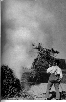
Der Kartoffelacker wird gesäubert. Mit Vergnügen verbrennen die Buben die dürrsten Stauden und freuen sich an Feuer und Rauch