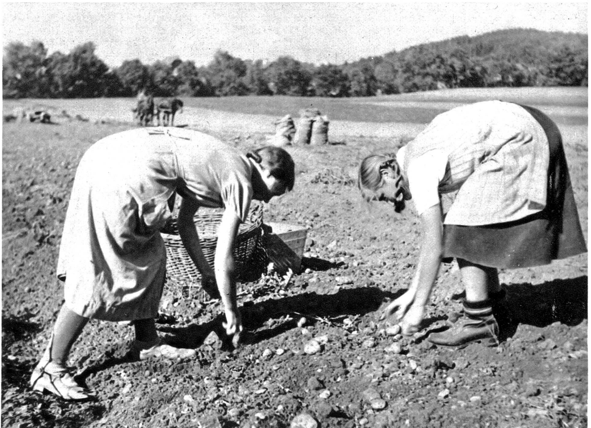
Alle zwanzig bis dreissig Schritte gruppieren sich gefüllte Säcke und bald wird sie der Karrer mit dem Wagen abführen