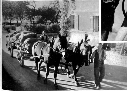
Mit dem schwerbeladenen Wagen geht es nach Hause