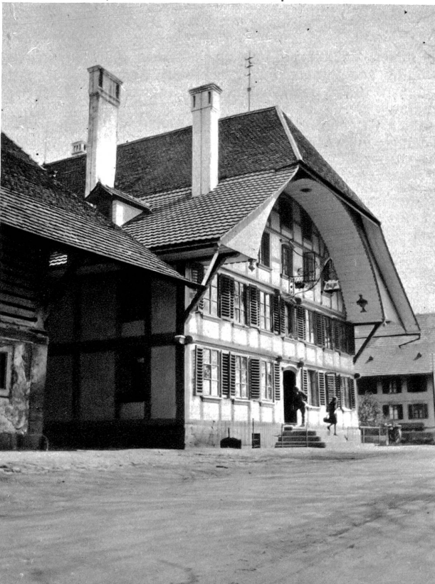
Gasthof zum Ochsen in Lützelflüh, wo Jeremias Gotthelf seine Studien machte

Natürlich gehen wir auch hinüber ins Pfarrhaus, 1665 gebaut. Es hat seit Gotthelfs Zeiten sein Aussehen wenig verändert, ist so recht ein Bild pfarrherrlicher Behäbigkeit. Mitten in einer großen Hoffstatt liegt es, unter deren Bäumen Gotthelf