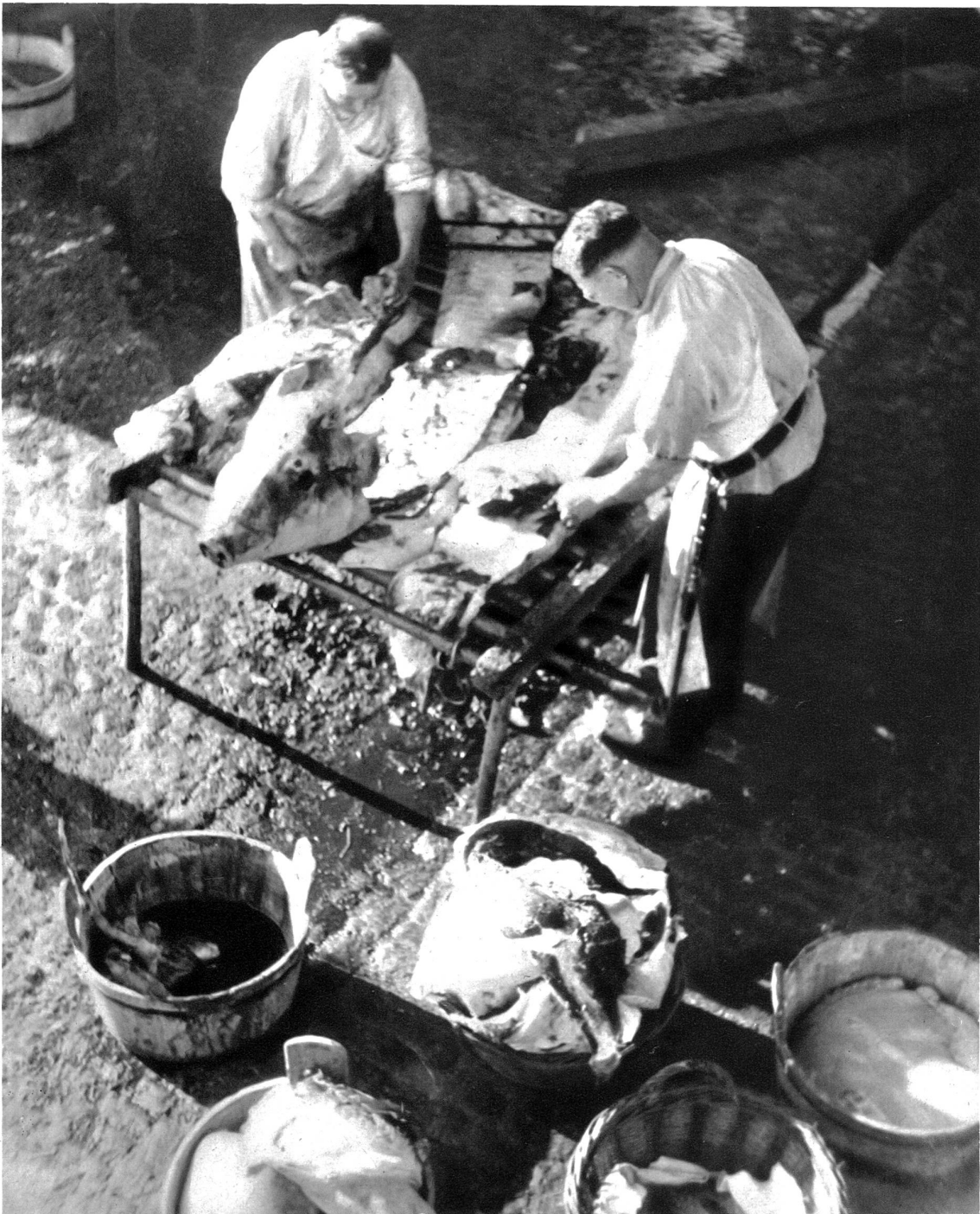
Auf dem Doppelschragen wird operiert

In der Küche brodelten inzwischen für die beiden Metzger die Bratkartoffeln und in der Pfanne nebenan zischte ein gehöriger Macker Schweinebraten im eigenen Fett. Auf dem Holztisch stand Kübel an Kübel mit Hackfleisch. Noch vor der Mittagszeit begann man mit der umfangreichen Wursterei. Dann wurde zu Tisch gerufen. Wer da keinen Platz findet, wird in die Dorfwirtschaft verwiesen, wo ebenfalls ein wahrhaftes Mittagessen bereit steht. Ein buntes, reges Leben herrscht in der Gaststube, Händler, Bauern und Arbeiter sind da. Unter