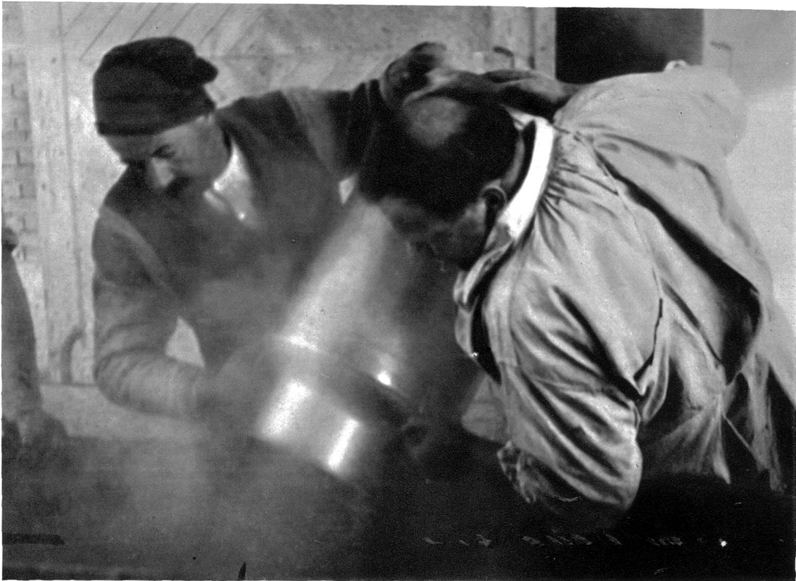
Die Bütte wird mit siedendem Wasser angefüllt