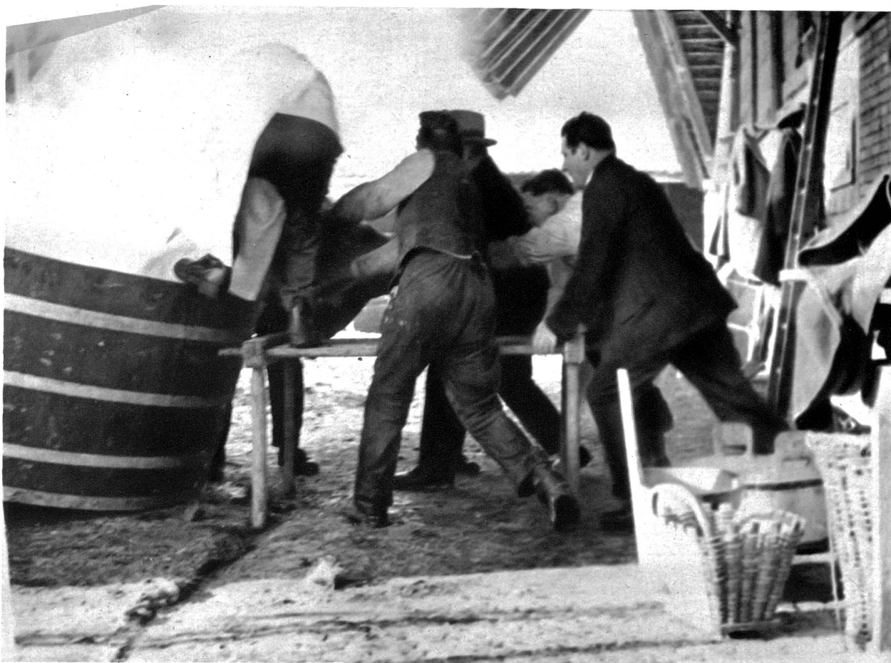
Sieben Mann halfen das 450 kg schwere Tier in die Bütte zu rollen.