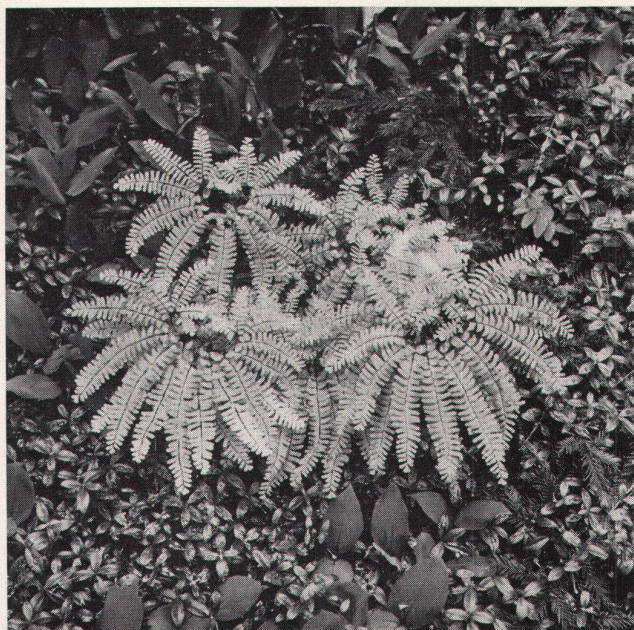
Haarfarn, Adiantum pedatum , über Immergrün, Vinca major und Maiglöckchen, Convallaria majalis

Anfang September wurde in Bern am Läuferplatz 6 eine neue Galerie eröffnet. Die erste Ausstellung ist dem 1918 in