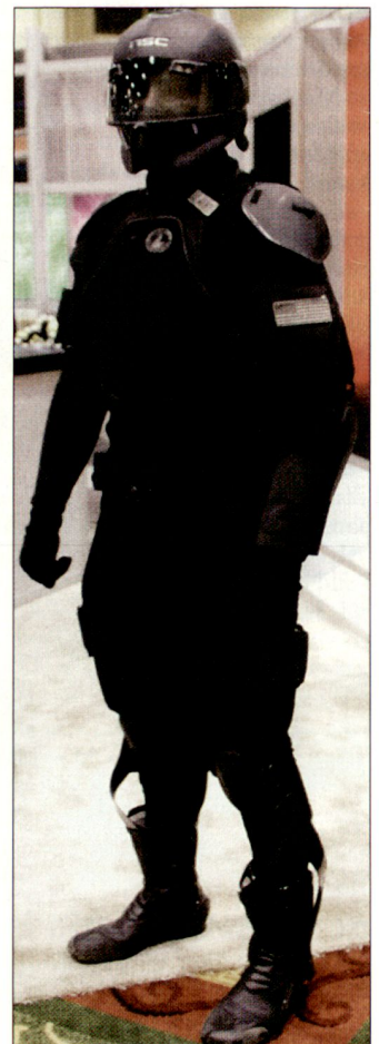
Uniform der Zukunft, vorgestellt durch das Entwicklungslaboratorium der US Army in Natick, Mass. ■

Während gemäss Aussagen der militärischen Planungsstellen die meisten dieser neuen Technologien erst im Zeitraum von fünf bis fünfzehn Jahren verwirklicht werden können, sollen Prototypen der neuen Feldintensivstation bereits in Afghanistan und bei den US-Truppen im Irak im Einsatz stehen. hg