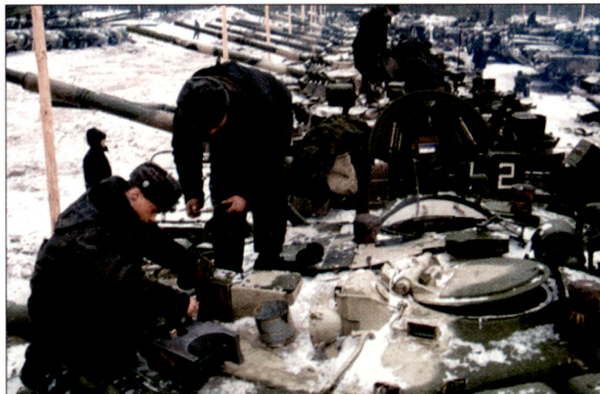
Weiterhin zu hohe Kampfpfanzerbstände in den russischen Streitkräften.

Ein grosser Teil des restlichen Kampfpfanzerpotenzials, bestehend aus veralteten Typen T-55, T-62 und T-64, ist grösstenteils in Depots eingelagert und dürfte nur noch beschränkt einsatzfähig sein. Die im Truppendienst stehenden Typen T-80 und T-90 sowie die Zahl der bisher modernisierten T-72 soll heute rund einen Drittel (ca. 8500) des gesamten Panzerparks ausmachen. Bisher können in Russland, vermutlich aus finanziellen Gründen, jährlich lediglich 250 bis 300 veraltete Kampfpanzerzeuge der Vernichtung zugeführt werden. Zudem besteht heute nur noch ein beschränkter Markt für veraltete Kampfpanzerzeuge.