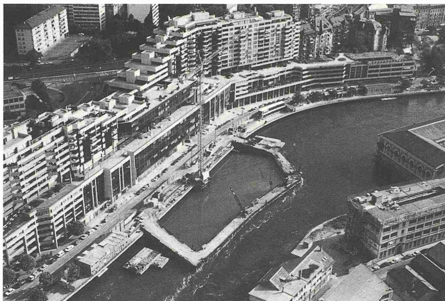
Bild 3. Bau des neuen Regulierwehres in der Rhone in Genf

Der Bauingenieur ETH muss sich durch seine Allgemeinbildung und sein umfassendes Fachwissen auszeichnen, die es ihm ermöglichen, Gesamtzusammenhänge zu erfassen, komplexe Probleme zu lösen und in unvorhergesehenen Situationen richtig zu handeln.