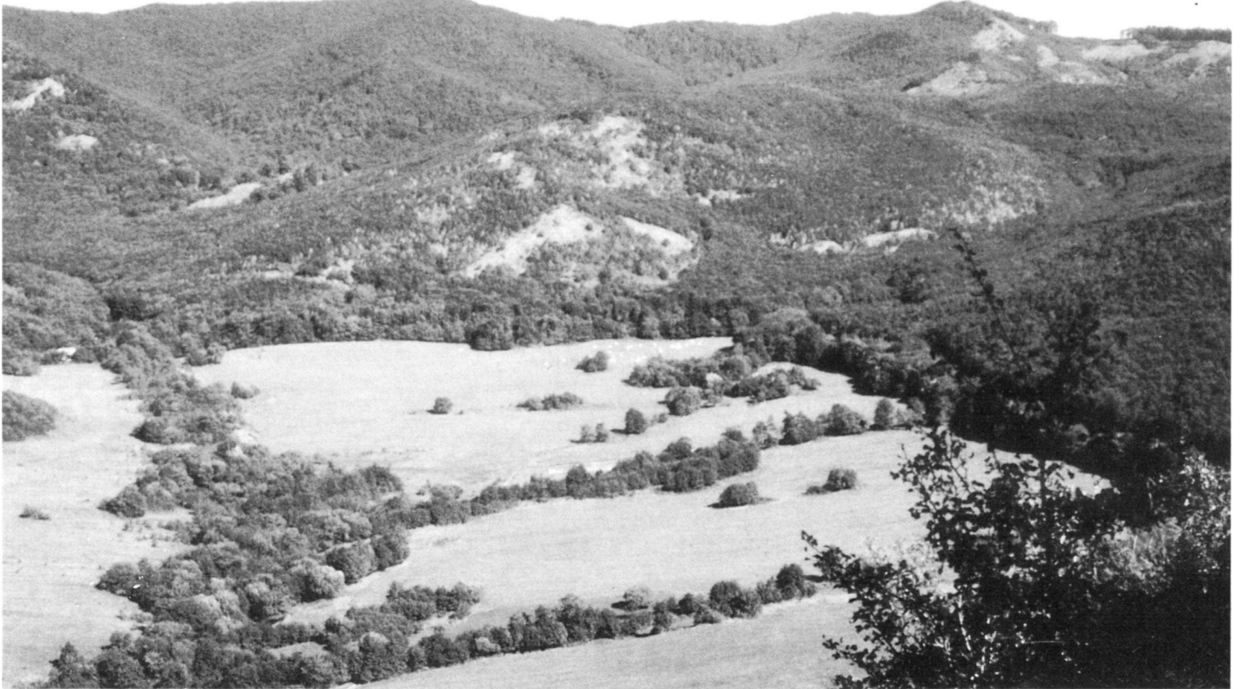
Weideland in der Landschaft.