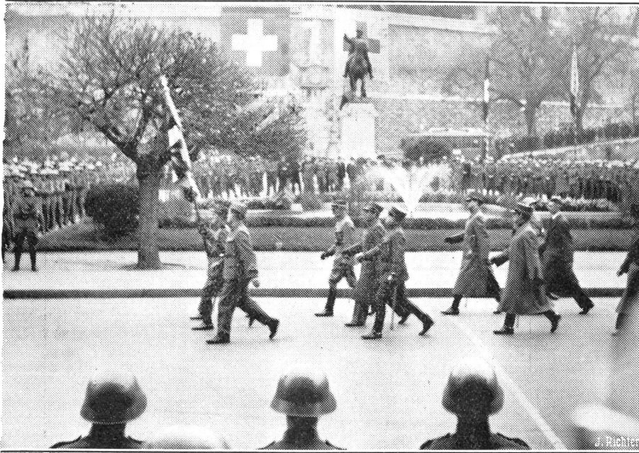
Die grosse General Dufour-Feier in Genf

Die militärischen Vertreter marschieren am General Dufour-Denkmal auf dem Place Neuve vorbei.